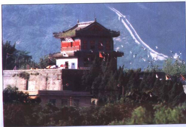
天下第一关——山海关