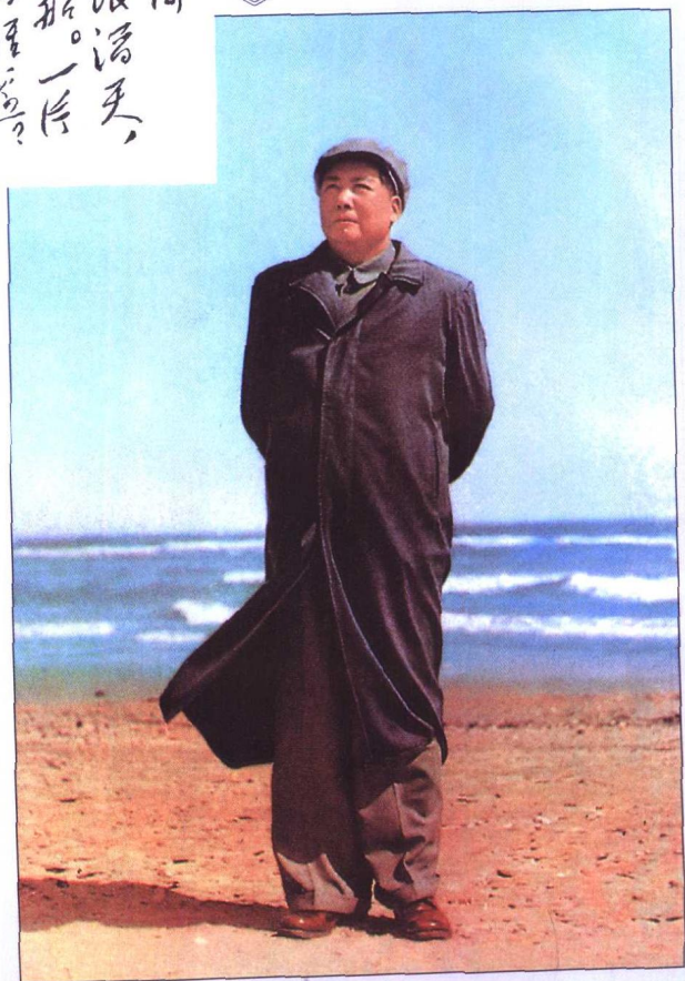
1954年毛泽东主席在北戴河海滨

浪淘沙 北戴河 大雨落幽燕，白浪滔天， 秦皇岛外打鱼船。一片 汪洋都不见，知向哪里？ 往事越千年，魏武挥 鞭，东临碣石，气壮山河。 萧瑟秋风，今又是，换了 人间。