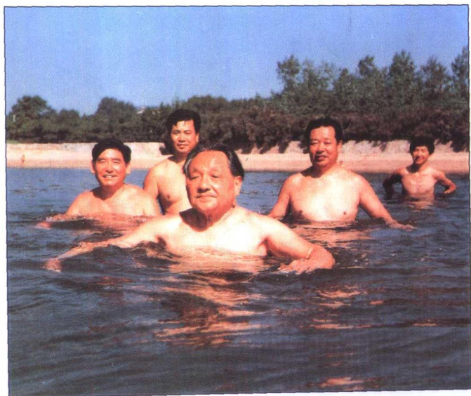
1986年邓小平在北戴河海滨