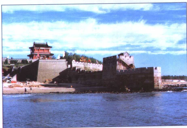
长城入海处——老龙头