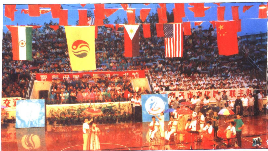
秦皇岛国际民间艺术节