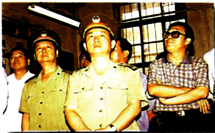
同心曲——陪山西省军区政委陈德毅视察忻州