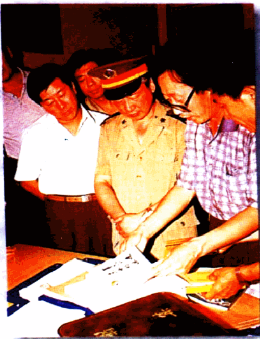
俯拾皆缘——与中共忻州地委书记梁滨同志向 山西省军区政委介绍忻州双拥工作情况