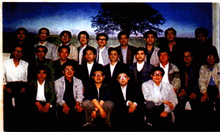
群英会——为下县任职诸友饯行