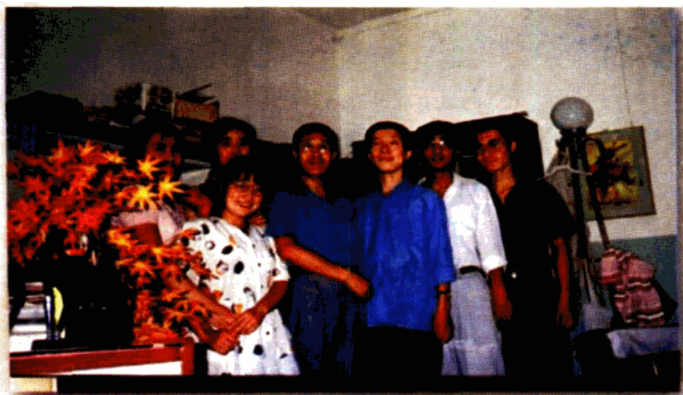
弟子三千，常系吾心——“团补校”文三班的学生登门看望老师