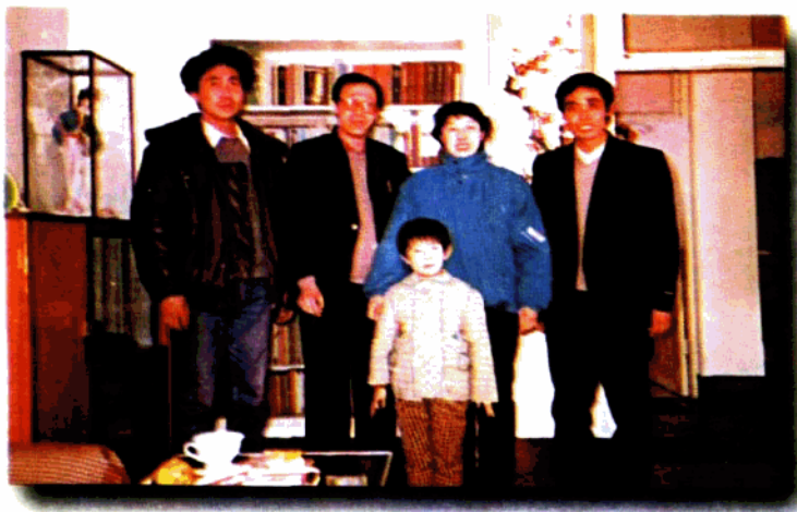
在籍振芳老师家中