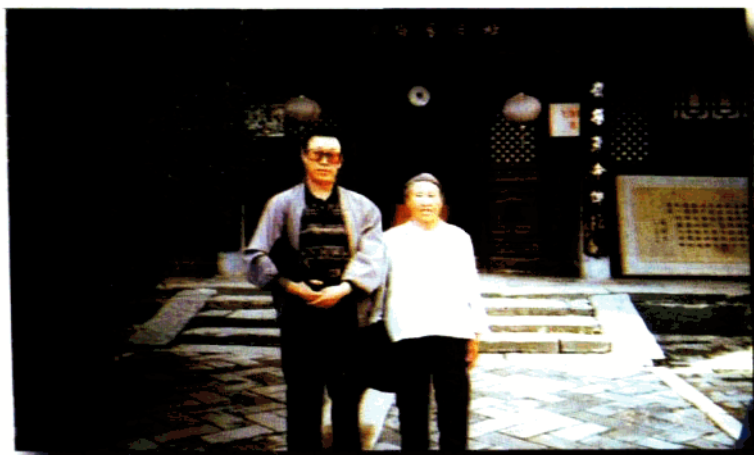
与母亲参观五台山毛主席路居馆