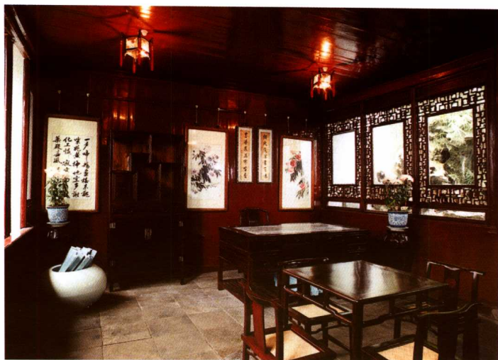
照0-1-4 网师园殿春簃西侧书房内景

苏州园林假山寓意为文人们的山居崖栖、高逸遁世,堆掇富于林壑气象的山体是造园的基本内容,“名园以叠石胜”,这是明清以来形成的一种共识。苏州园林假山,多为诗画艺术家与叠山匠师合作的产物,尤其是明末清初集