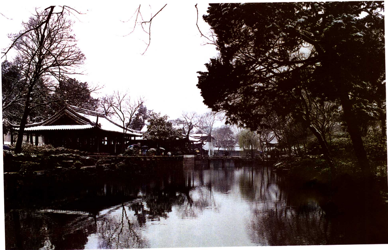
照0-1-1 拙政园中部雪景（引自《苏州园林》）