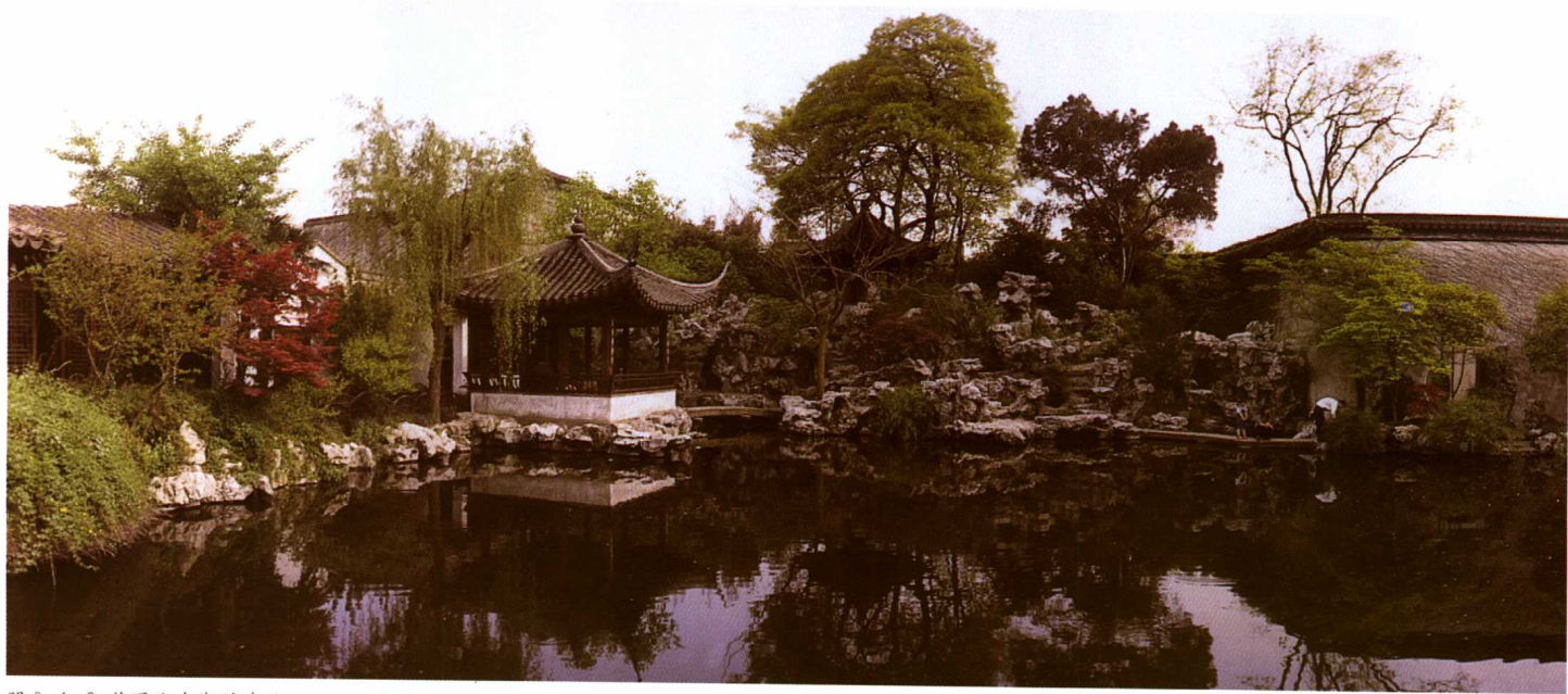
照 0-1-2 艺圃池南湖的建筑、山石、水和植物的组景

生态、趋吉避凶的环境心理、藏风聚气的环境模式等；二是“远往来之通衢”，僻处小巷深处，杂厕于民居之间。追求“结庐在人境，而无车马喧”的境界；再用“隔凡”、“隔尘”的围墙，围出一方净土。园内竭力追求顺应自然，着力显示纯自然的天成之美，并力求打破形式上的和谐和整一性，师法自然、模山范水，将多方胜景纳入园中，在有限的园中，创造出具有“物外情，景外意”的无限空间。那里宁静、素雅、淡泊、幽深，是人与自然和谐相处的最佳居住空间，成为人类环境创作的典范。苏州园林是一种创造性的天才杰作，是千百年来中华文明乃至人类文明发展中的一种艺术积淀。