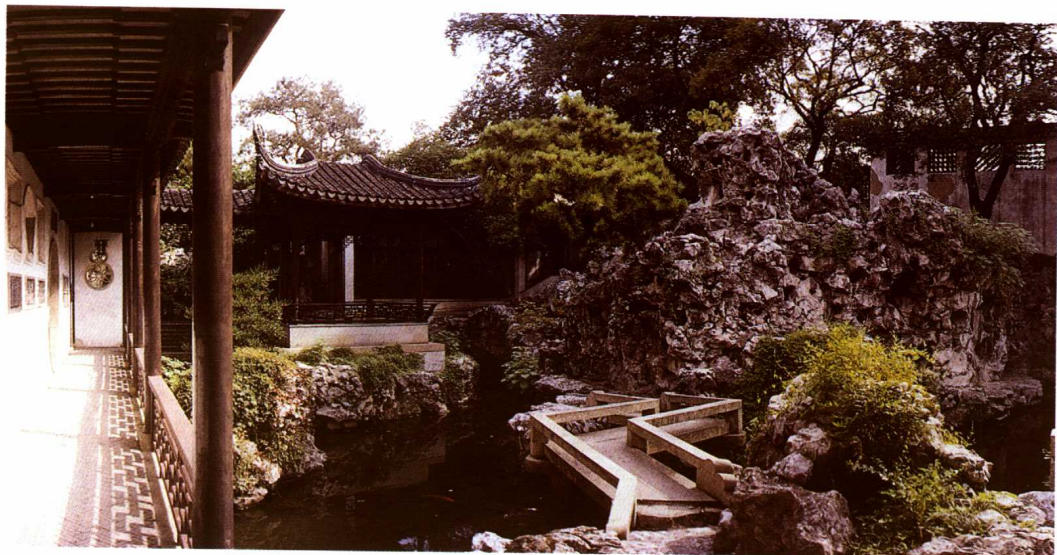
照 0-1-5 环秀山庄桥池假山

太湖石遗留在苏州，成为园林石峰上选。苏州的叠山艺术家根据美的原则，建构了一套置石艺术规则：讲究石峰的姿态、背景的选择、意境的构思等。