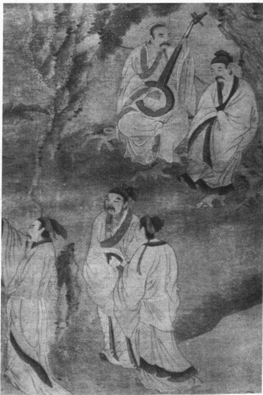
元趙孟頫《西園雅集圖》