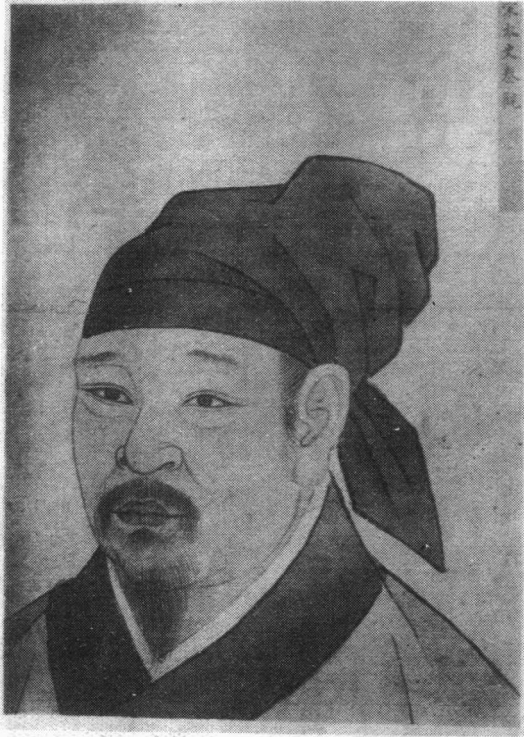
秦觀像 南薰殿歷代聖賢名人像