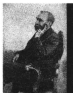
世纪诺贝尔文学奖获得者辞典

主 编: 杨建邺 副 主 编: 余永乐 编 者: 刘小英 刘小军 刘剑波 李继宏 余永乐 杨建邺 徐 斌 徐长生 郭新力 黄世新 策 划: 彭小华 责任编辑: 郭庭军 余敬慧 明廷雄 周雁翎 装帧设计: 刘福珊