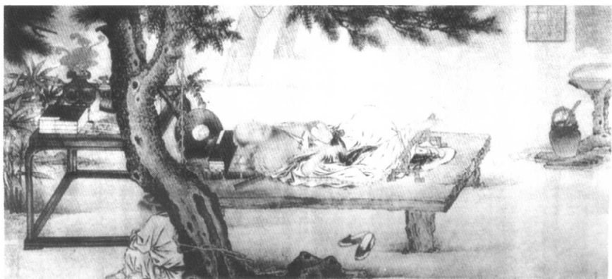
图3 元代画家刘贯道梦蝶图