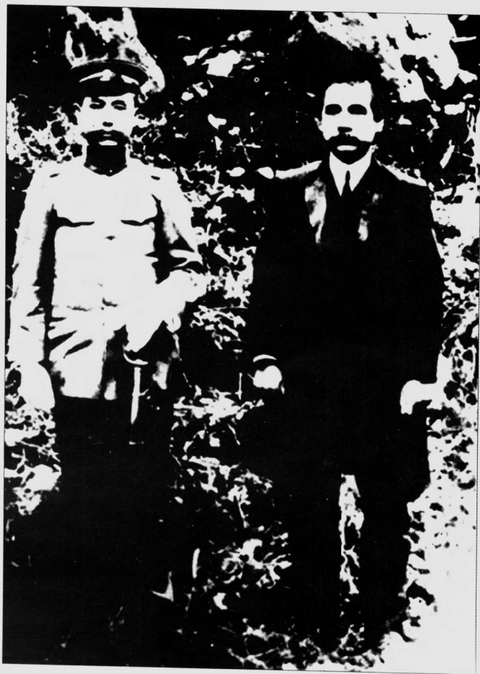
1912年与孙中山先生合影