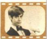
David Copperfield 大卫·科波菲尔