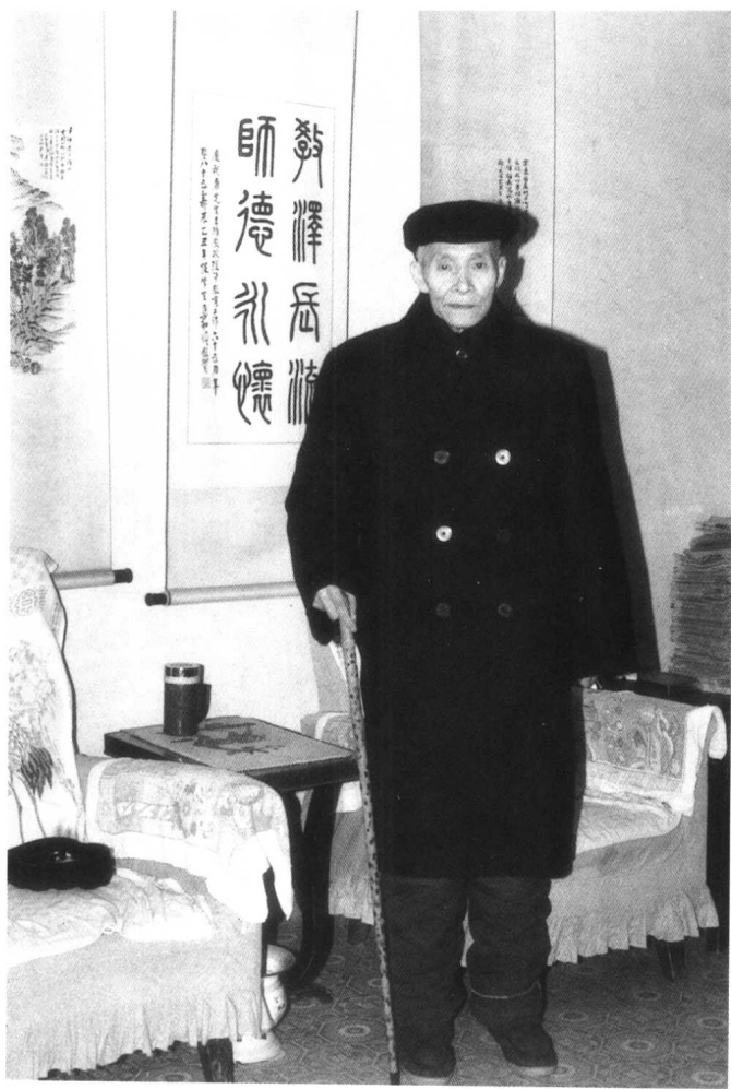
1985年12月在家中客厅散步