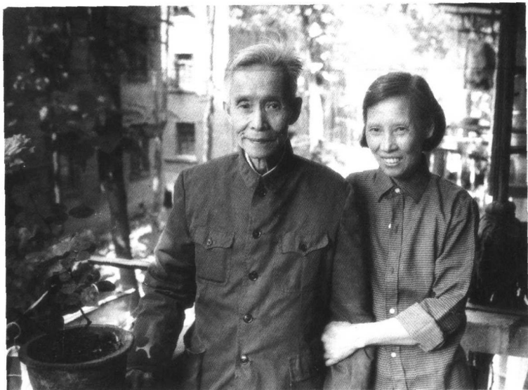
父女相依——1987年6月摄于家中晒台一角