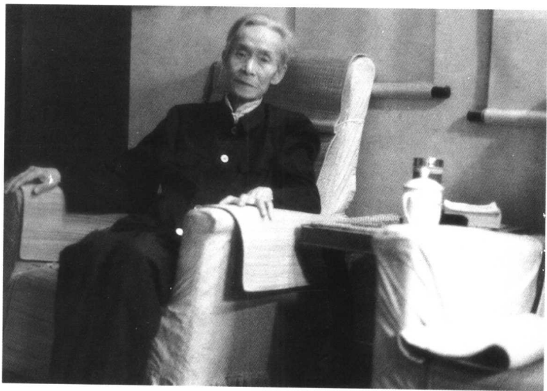
1988年7月31日在家中，来访客人人为之摄影留念