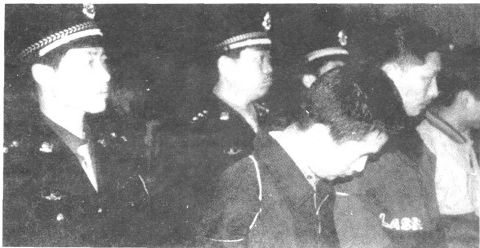
犯罪分子向正义低头。