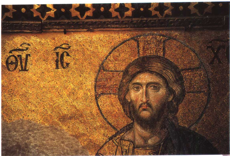
▲ 圣索菲亚大教堂内部