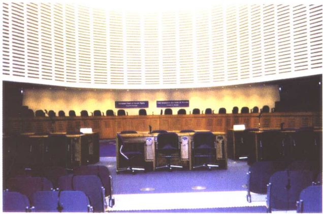
欧洲人权法院法庭内景 (European Court of Human Rights)