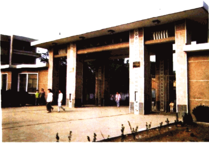
河北正定中学校门