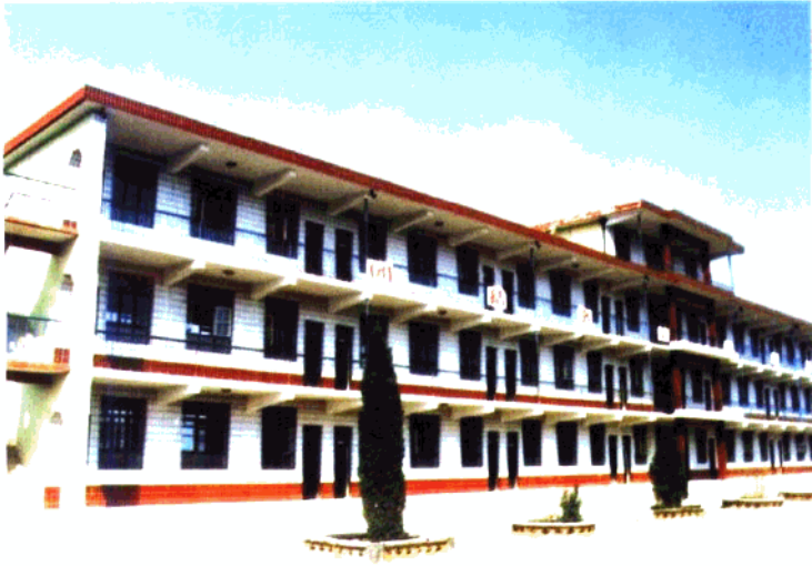
正定县南岗乡中学教学楼