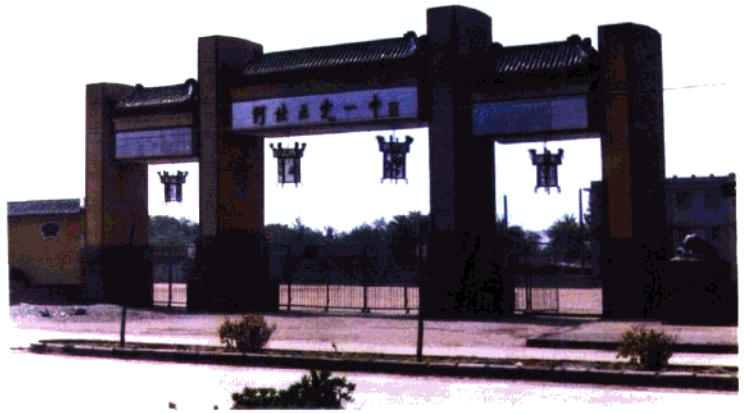
河北正定县一中校门