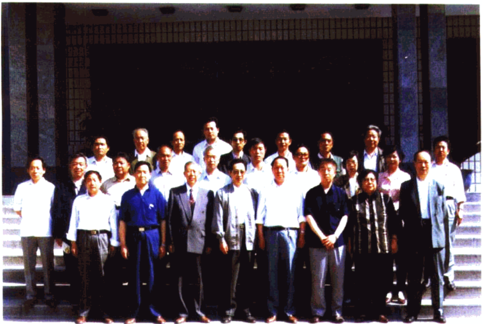
参加县教育志第二次评审会的专家、教授、市、县领导及兄弟县 (区、市)局长、主编与县教育志编写人员合影