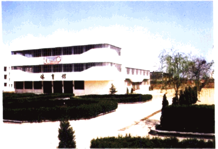
河北正定师范学校体育馆