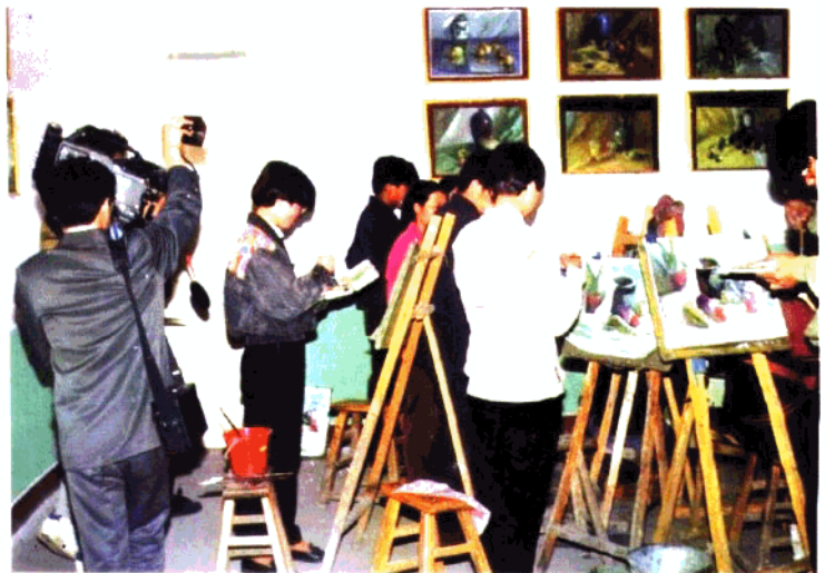
正定县第二中学 美术班学生在作画