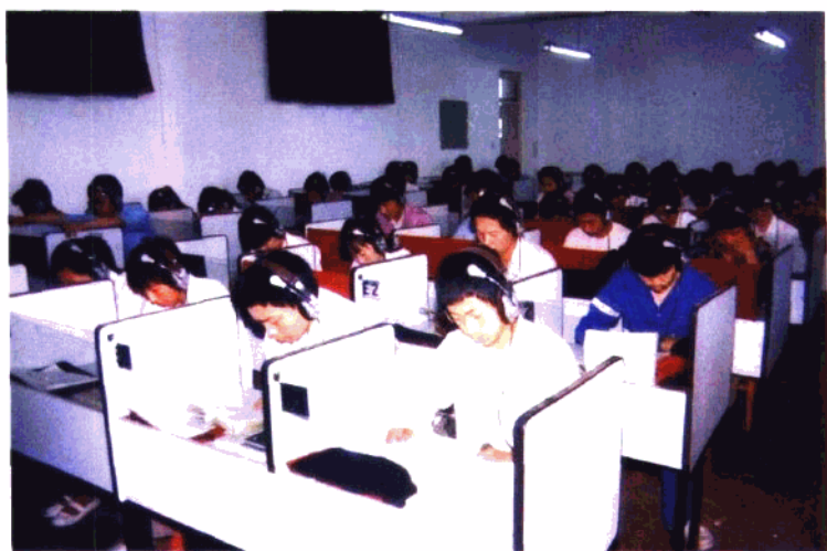
河北正定中学语音室