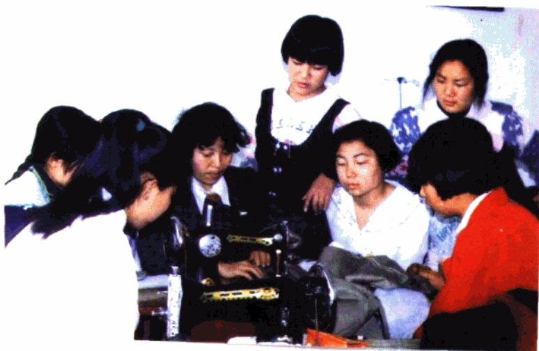
正定县职业中学服装专业教师指导 学生缝制服装