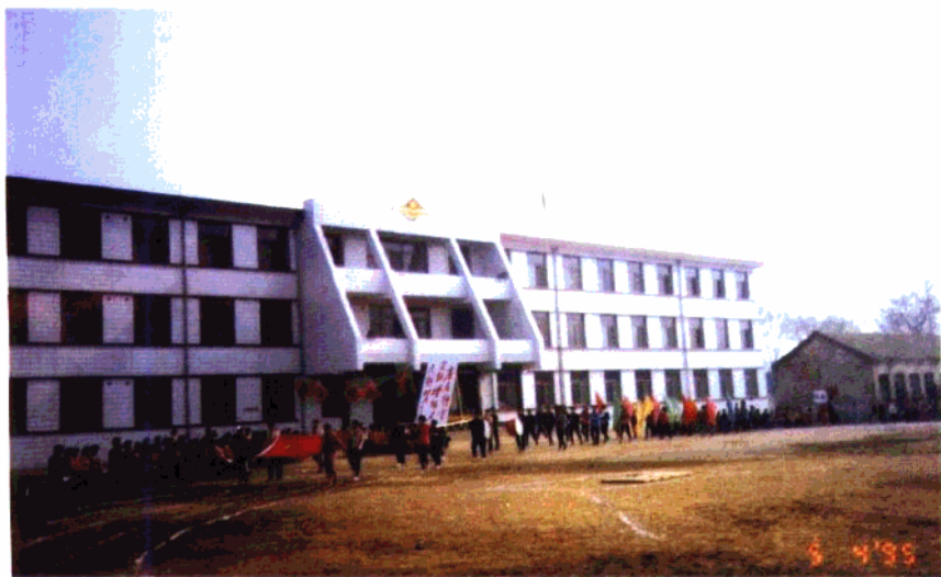
正定县西兆通学校 军乐队在活动