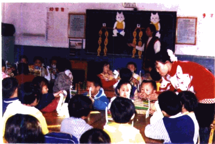
县幼儿园教师在上计算课