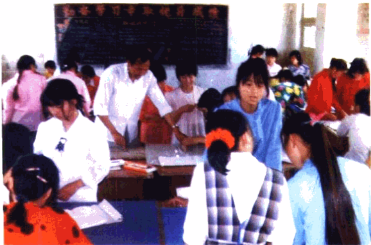
正定县东权城乡技校聘请剪裁师给初中生讲裁剪技术