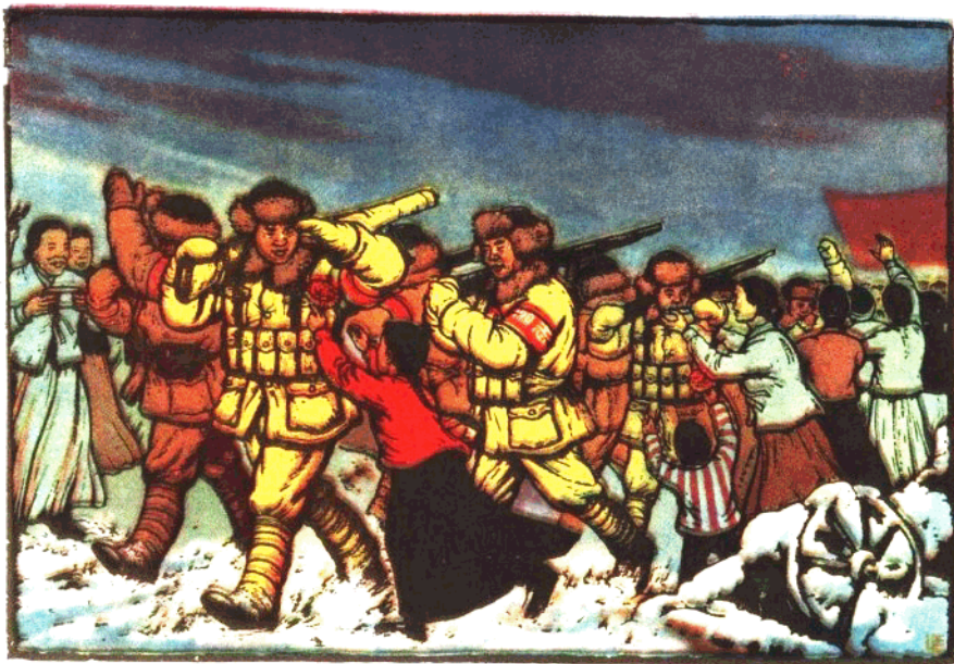
朝鮮人民熱愛中國人民志願軍