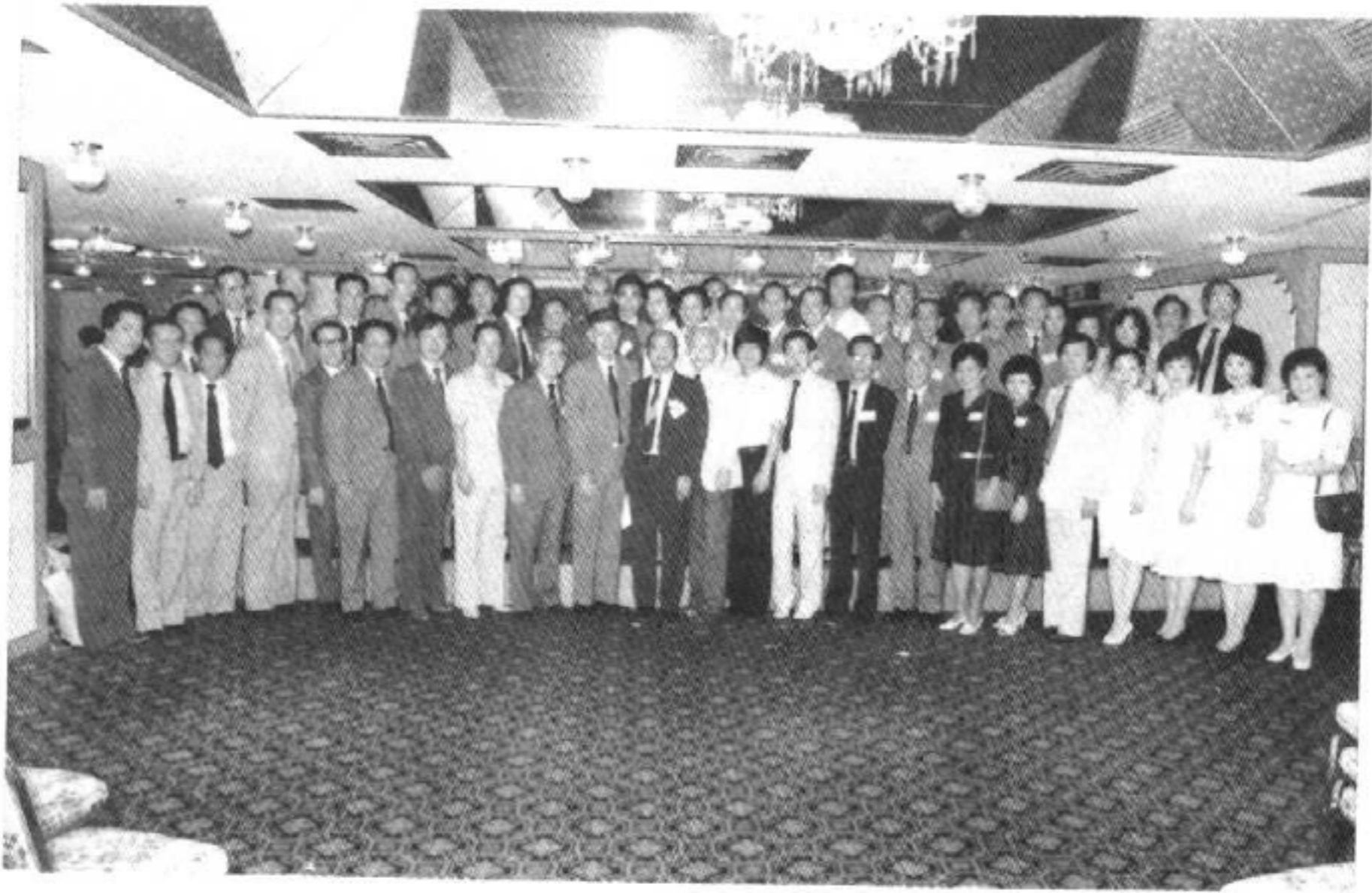
1983年，汕头市潮乐演奏团，接受旅港潮籍知名人士庄静庵、李嘉诚、丘士俊等的邀请，赴港演出。图为演奏团抵港时，在九龙火车站与前来欢迎的旅港同胞及潮乐界、戏曲界的朋友合影留念。