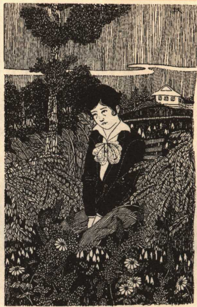
郁达夫小说《迷羊》插图(1927)/叶鼎洛

《迷羊》 叶鼎洛(1897—1958),小说作家,曾在杭州艺专学习美术,担任过美术教师。他曾与郁达夫合编《大众文艺》,并为达夫的小说《迷羊》作插图。《迷羊》再版多次,都保留了叶的插图。