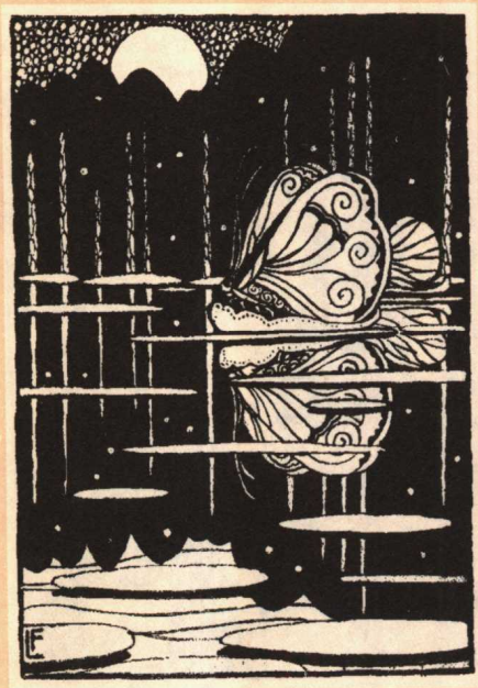
苏雪林散文集《绿天》插图(1928)/叶灵凤

《绿天》 叶灵凤(1904—1975)，作家，著有小说集《女媧氏的遗孽》，散文集《白叶杂记》等。苏雪林以绿漪的笔名出版的散文集《绿天》，1928年北新书局出版。叶灵凤既是小说家，又精于书籍装帧艺术，插图则不多见。