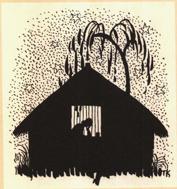
焦菊隐散文诗集《夜哭》插图(1926)/丰子恺

《夜哭》 丰子恺(1898—1975)，画家、作家，著有《子恺漫画》、《缘缘堂随笔》等。焦菊隐的散文诗集《夜哭》，1926年由北新书局出版，丰子恺为作封面及插图。《夜哭》为我国新文学史上出现的第一本散文诗集，丰子恺先生也是为新文学书刊作插图的先行者。