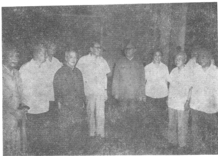
1980年在祝寿会前的休息室里