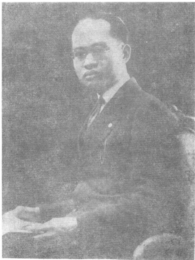
1930年在法国巴黎大学