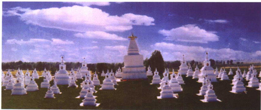
凉州白塔寺位于甘肃省武威市凉州区，塔林内建有西藏萨迦派宗教领袖萨迦班智达·贡噶坚赞的灵骨大塔，周环小塔九十九座。