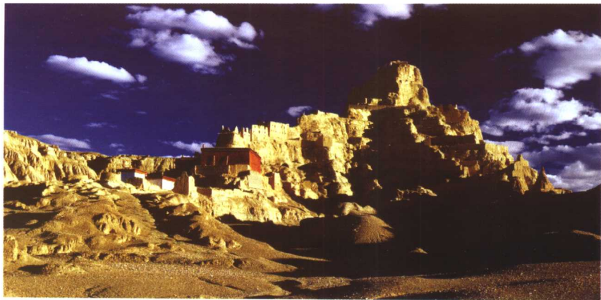
古格王朝遗址，位于西藏阿里地区札达县。