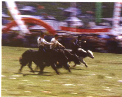
赛牦牛是惟有在藏区才能见到的民间体育活动，紧张、刺激，一般在节日期间举行。