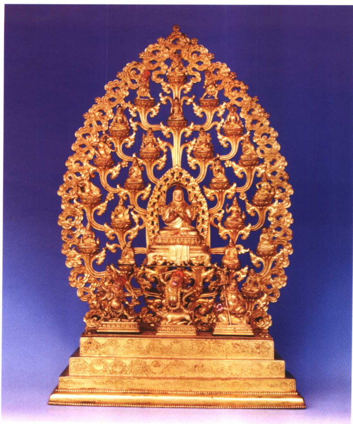
宗喀巴大师出生于青海省湟中县，是藏传佛教格鲁派的创始人。图为宗喀巴大师青铜塑像。