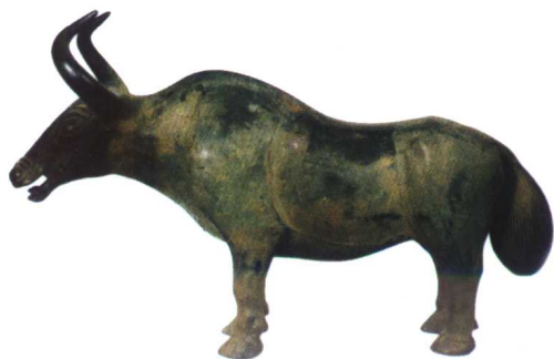
甘肃省天祝县出土的铜牦牛，是迄今为止国内惟一以牦牛为造型的青铜器文物。