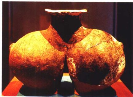
出土于西藏昌都卡若文化遗址的双体罐，是青藏高原上发现的最具代表性的陶器文物。