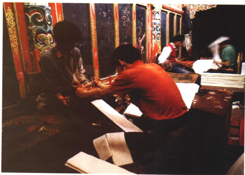
德格印经院始建于清雍正年间，位于四川德格更庆寺，藏有藏文木刻印版21万多块。