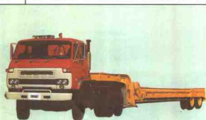
35 日产柴油机 UD NISSAN DIESEL CW50GT