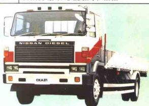
36 日产柴油机 UD NISSAN DIESEL CKA31 型 4×2 载重汽车 LHL