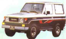
15 丰田 TOYOTA LANDCRUISER (陆地巡洋舰) 70 系列 FJ70LV-KR