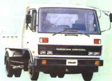
34 日产柴油机 UD NISSAN DIESEL CMA81 型 4×2 载重汽车 HHH