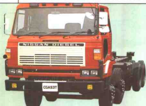
33 日产柴油 UD NISSAN DIESEL CGA53T