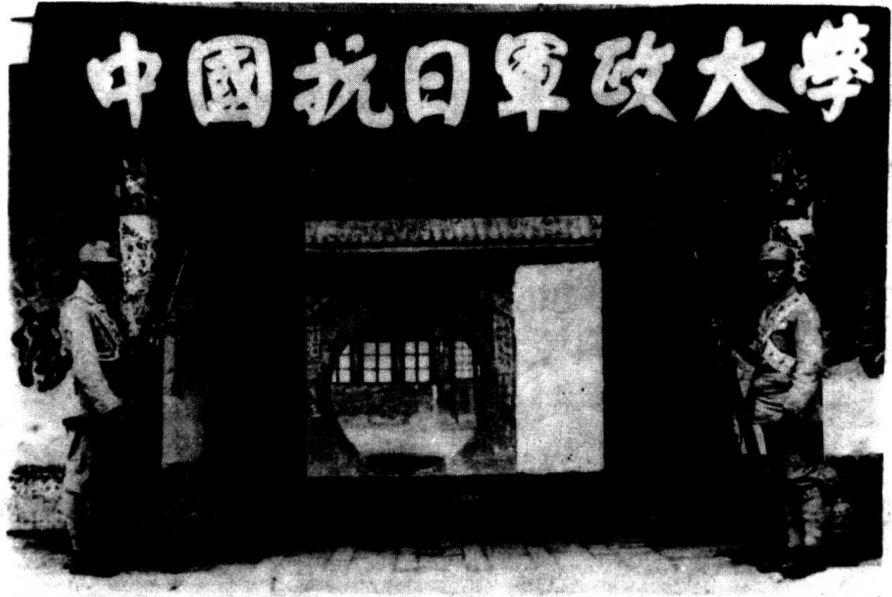
延安抗大总校校门