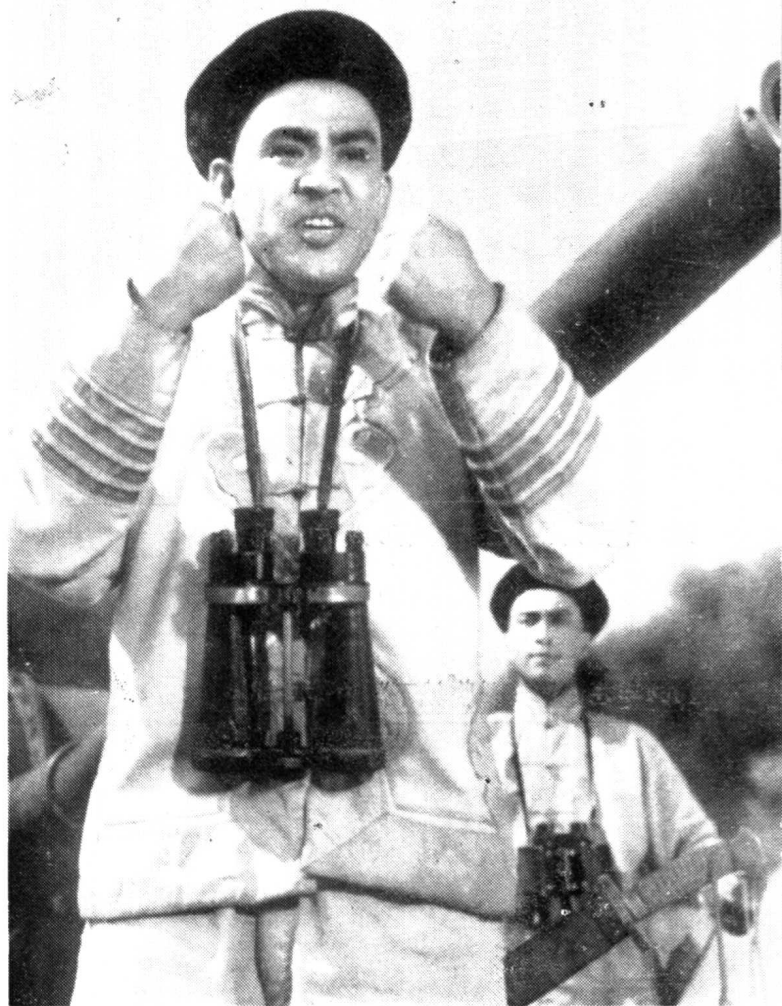
1961年在电影《甲午风云》中饰邓世昌。