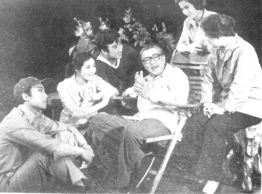
1982年在话剧《人生在世》中饰方正平。