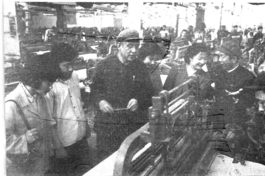
1979年和《报春花》剧组去瓦房店纺织厂深入生活。