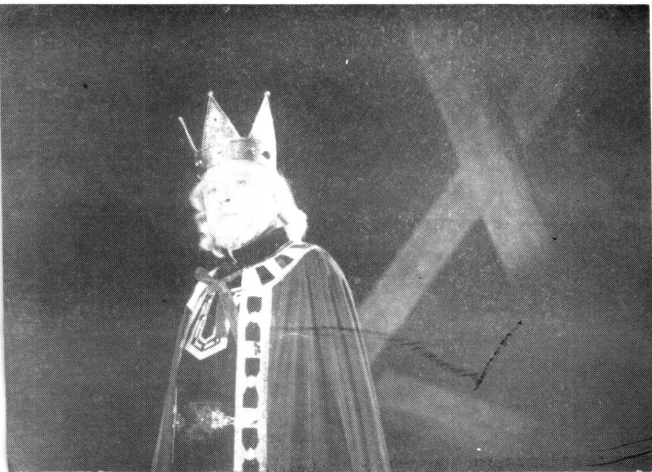
1986年在话剧《李尔王》中饰李尔。