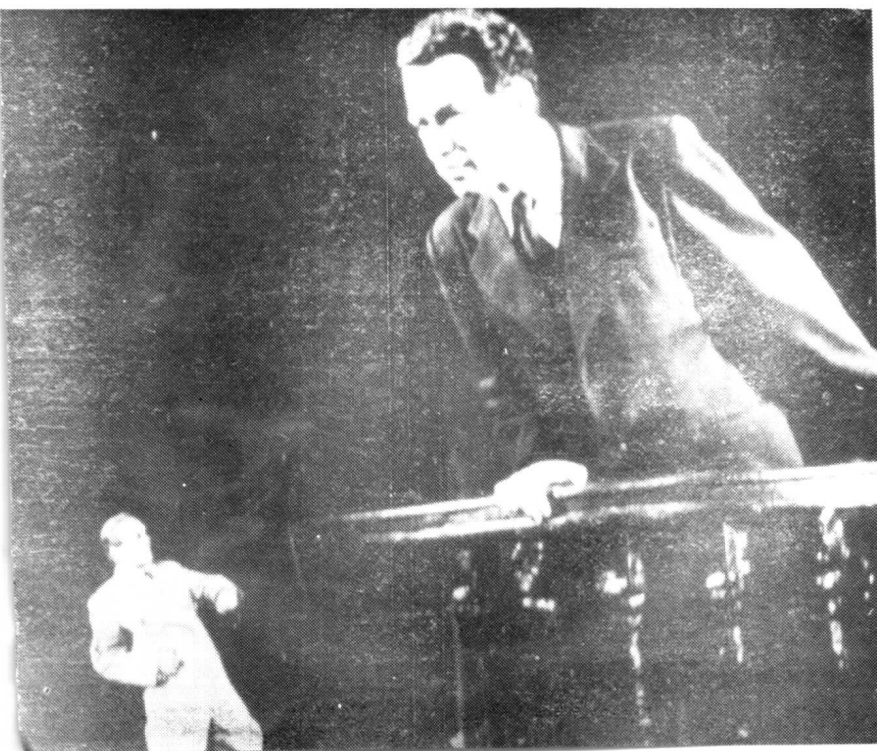
1959年在话剧《第一次打击》中饰季米特洛夫。