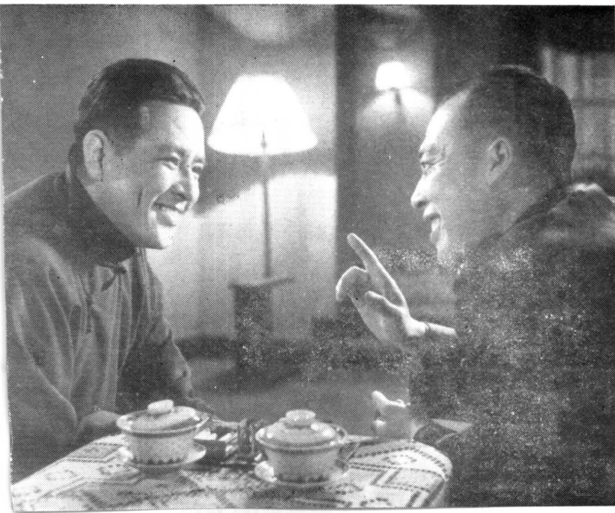
1964年在电影《兵临城下》中饰姜部长。