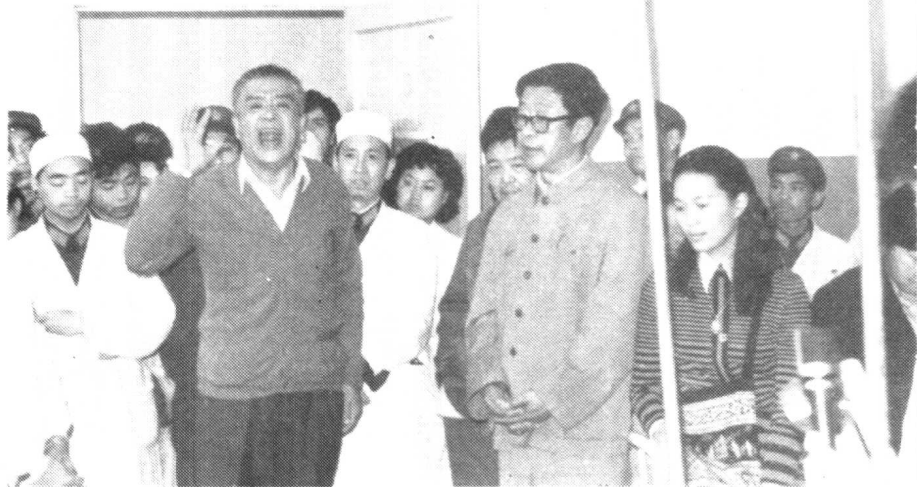
赴云南前线慰问解放军伤员。