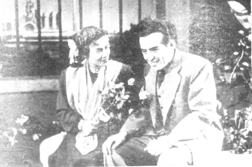
1951年在话剧《曙光照耀着莫斯科》中饰库列聘。