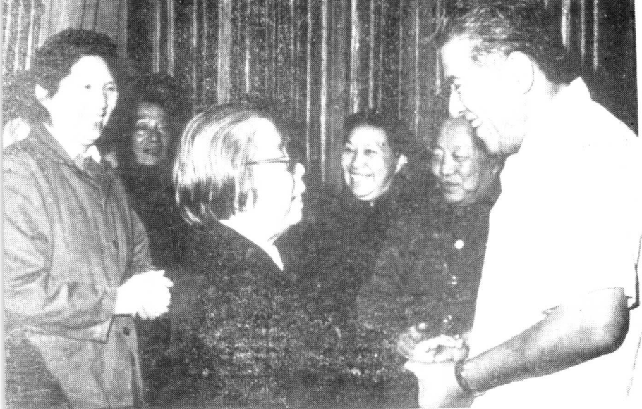
1979年会见邓颖超、陈慕华同志。