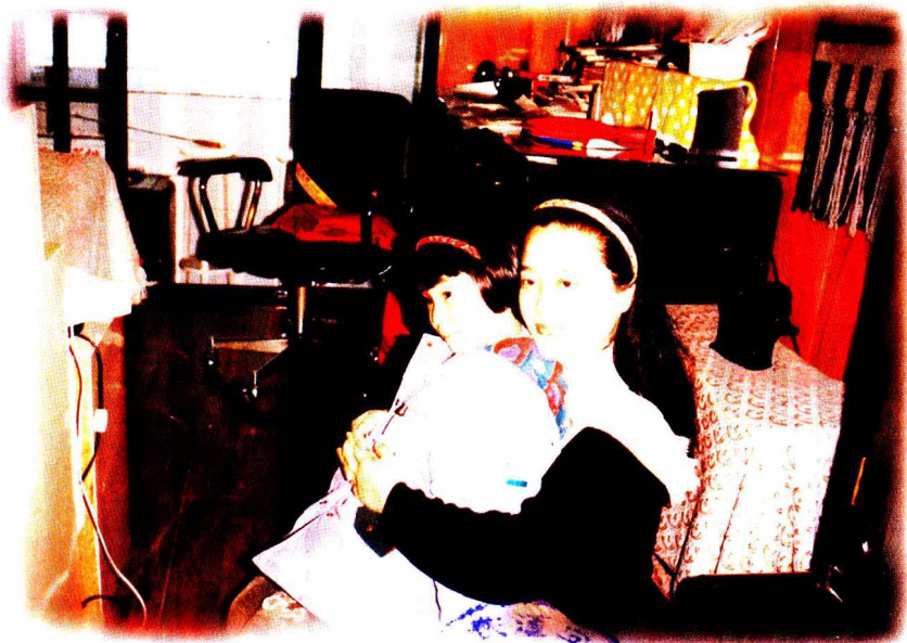
本书作者和本书插图、封面画作者合影