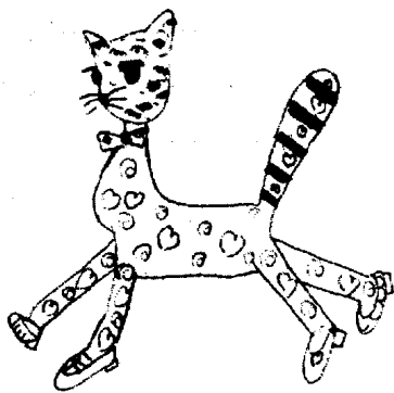
朱咪咪是一只骄傲的猫。