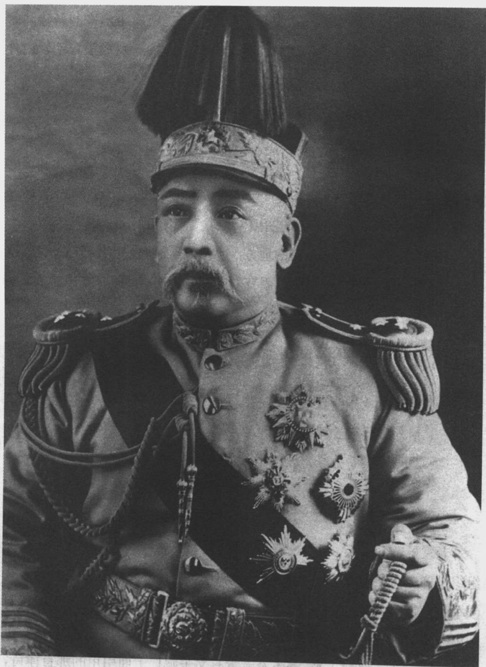
中华民国首任大总统袁世凯的标准照