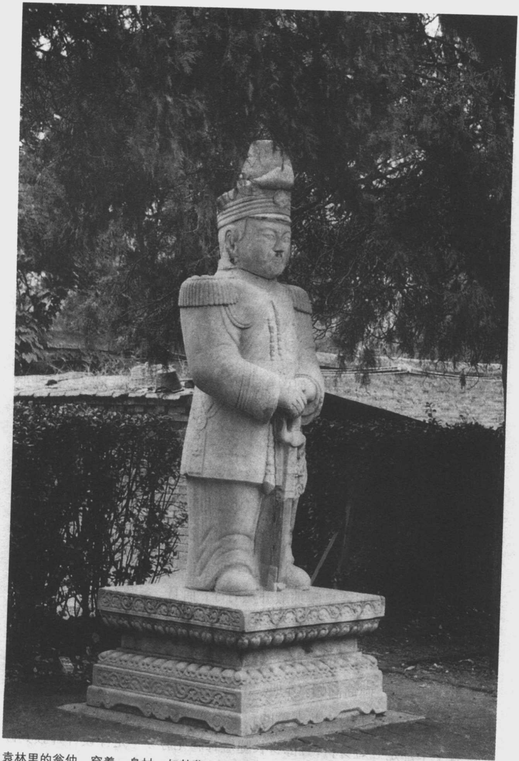
袁林里的翁仲，穿着、身材一如其墓主。