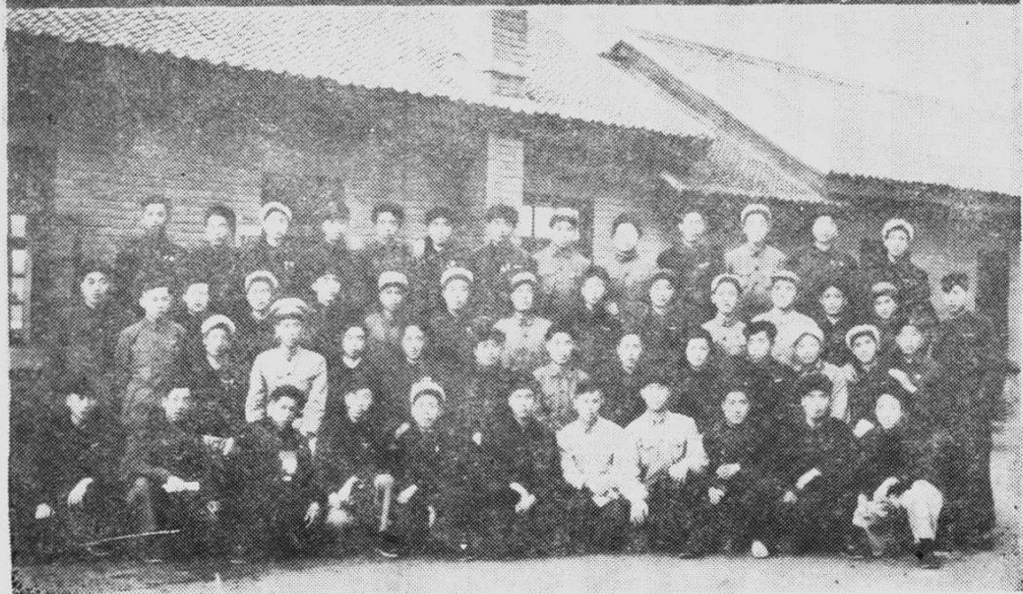
中国新民主主义青年团热河省二届一次委员扩大会议合影。 (1953年5月摄于团体大院)