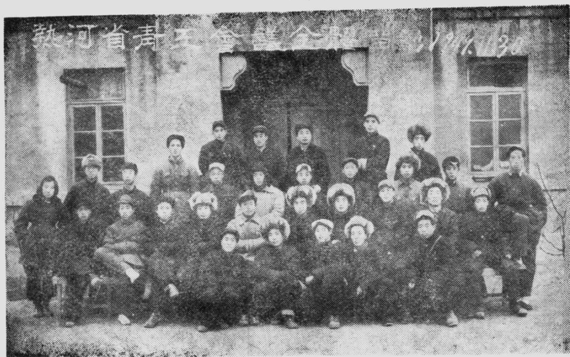
热河省第二次青年工作会议全体合影。