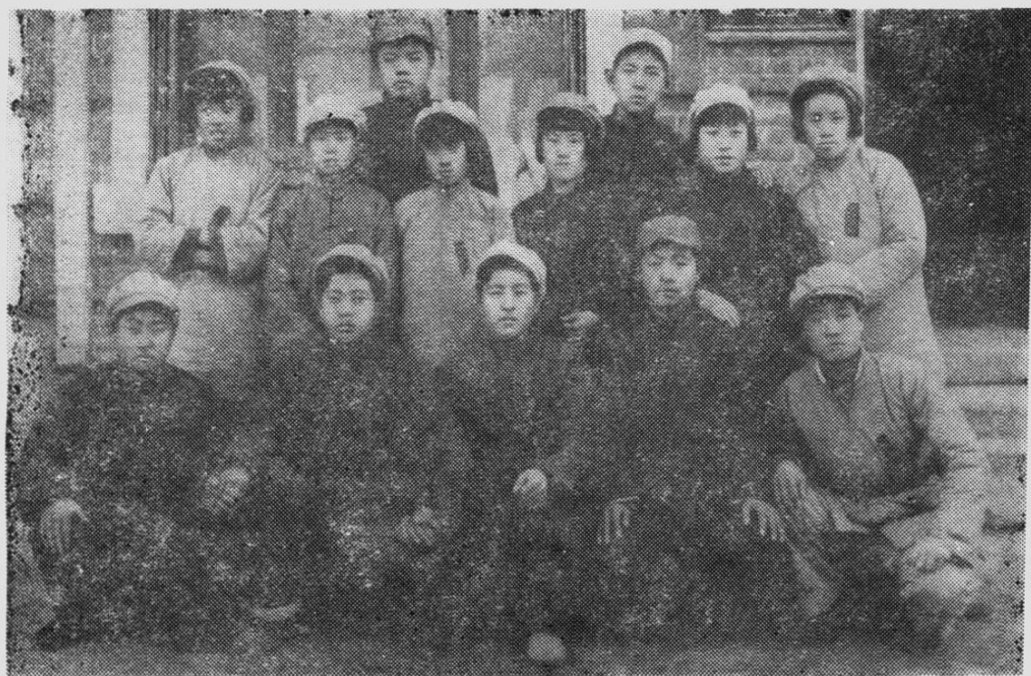
出席热河省第二届学生代表大会的凌源中学代表。