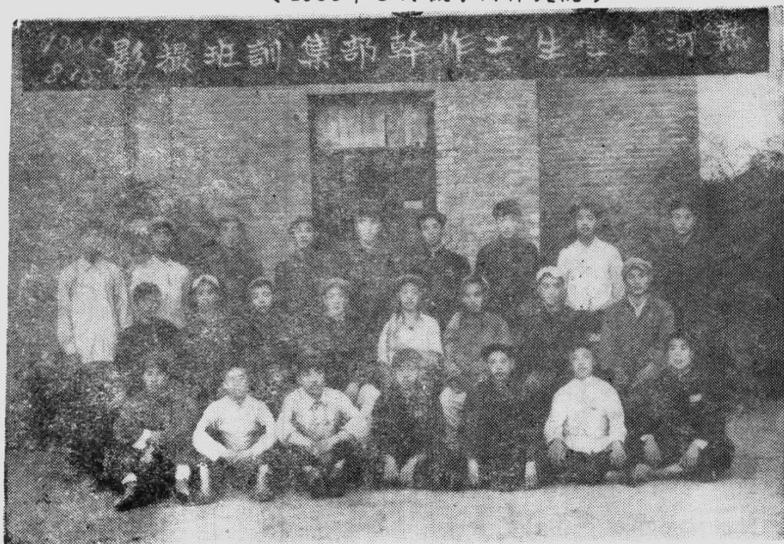
热河省第一次学生工作干部集训班合影。