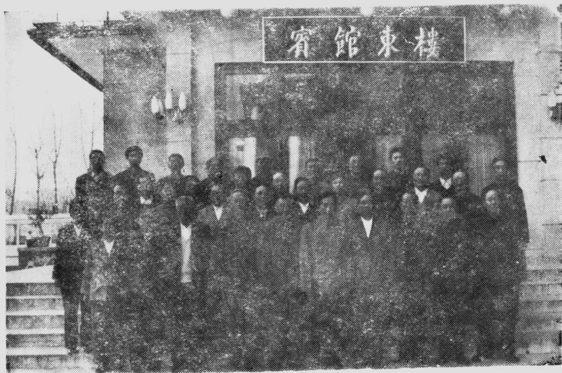
热河团史定稿会全体与会成员合影。 (1988年4月摄于承德山庄宾馆)