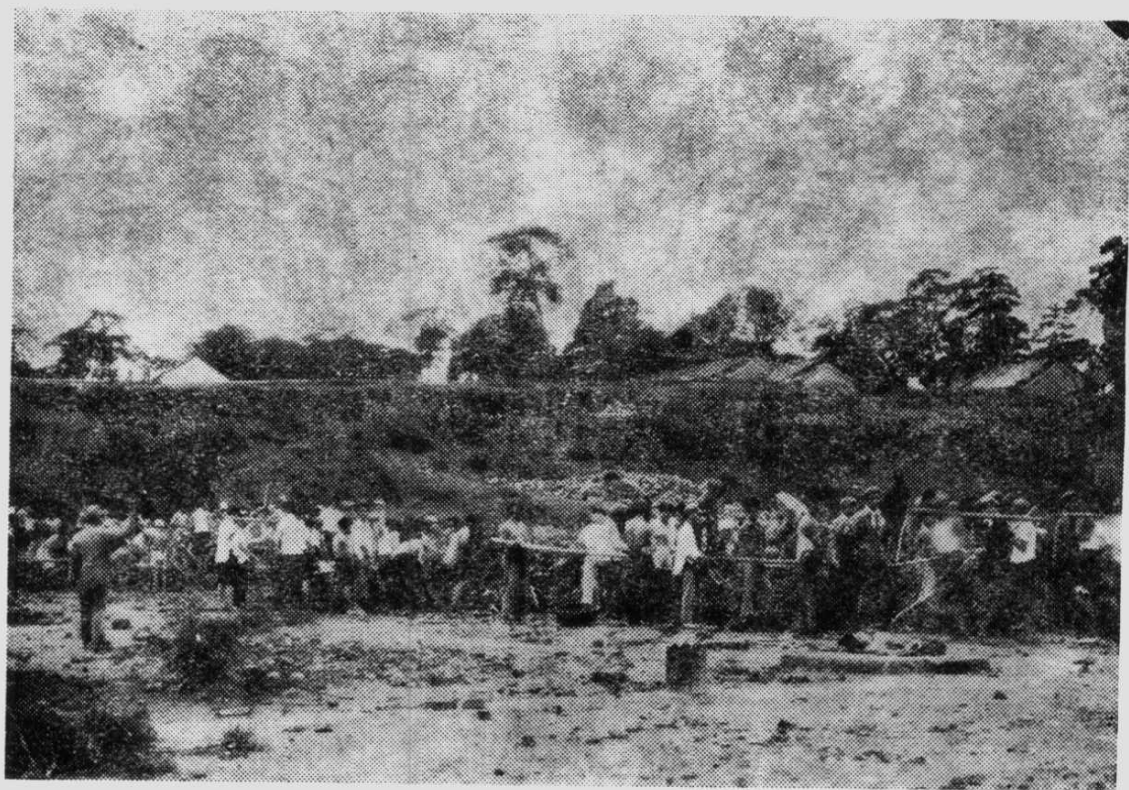
承德市各机关青年义务劳动清理离宫德汇门内广场。