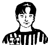
金元智 (Jīn Yuánzhì) 男, 韩国人

说明: 以上人物均为虚拟, 与现实生活中的同名同姓者无关。他们都是二三十岁的年轻人, 彼此之间的关系是朋友。