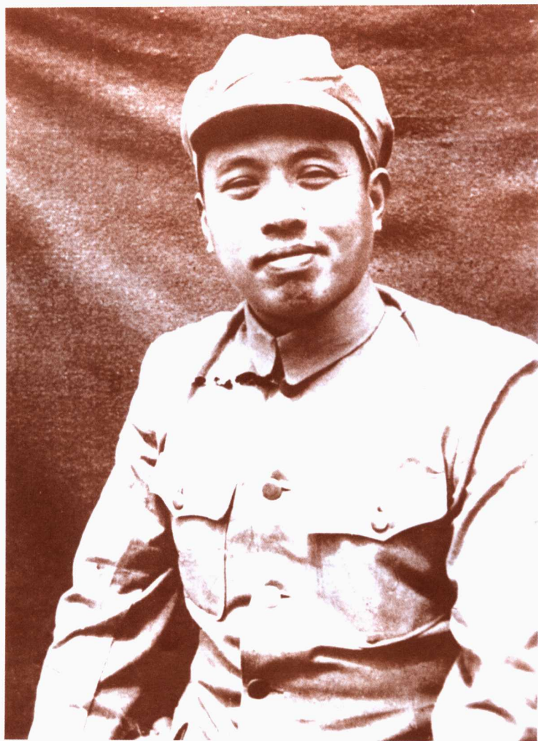
一九四九年二月，陈伯钧指挥四十六、四十七两个军赴湖南剿匪