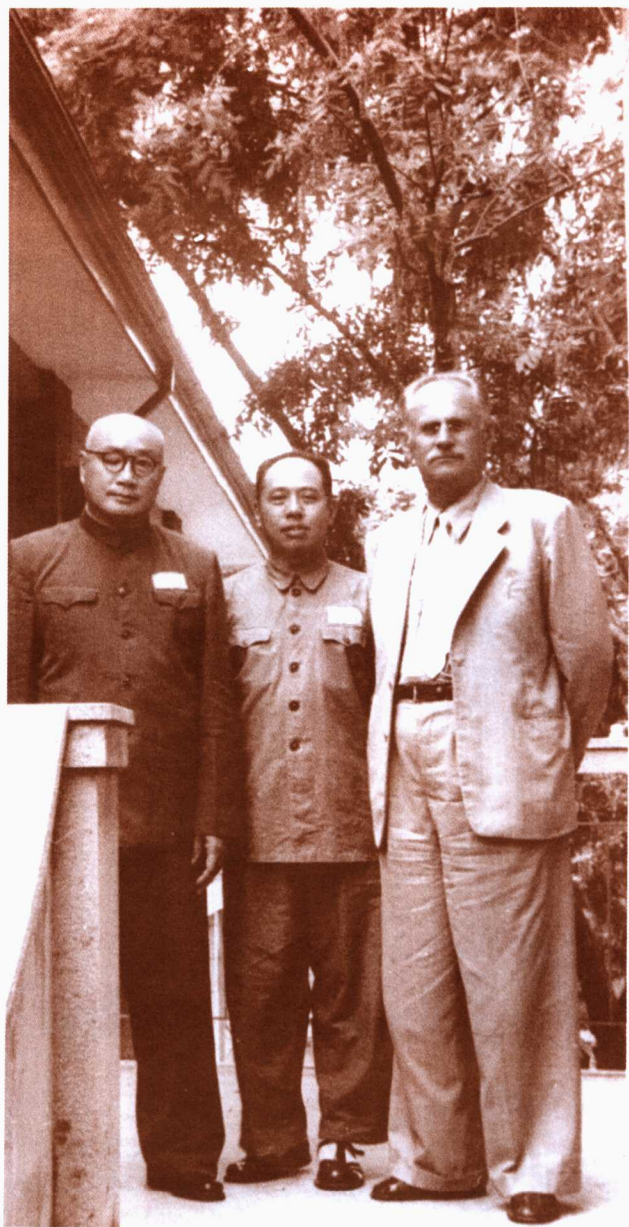
五十年代初，刘伯承、陈伯钧和军事学院 总顾问罗哈里斯基合影