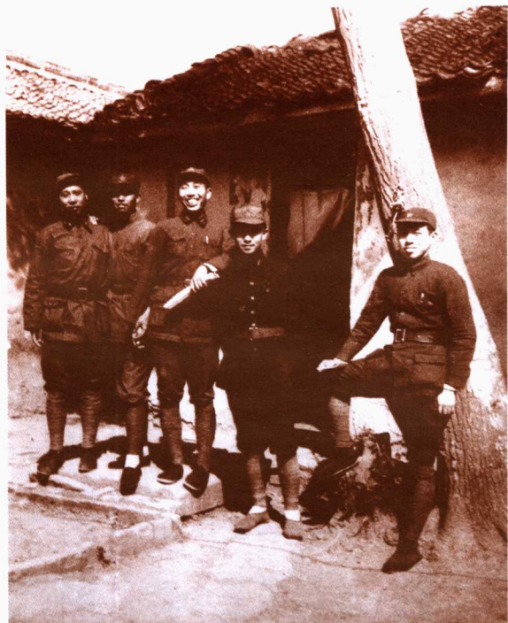
二方面军部分将领合影 右起：陈伯钧、关向应、 王震、肖克、甘泗淇