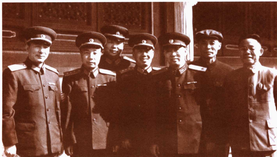
一九五六年国庆节在天安门城楼上 左起：肖向荣、肖华、陈锡联、陈伯钧、刘亚楼、吕正操、韩先楚