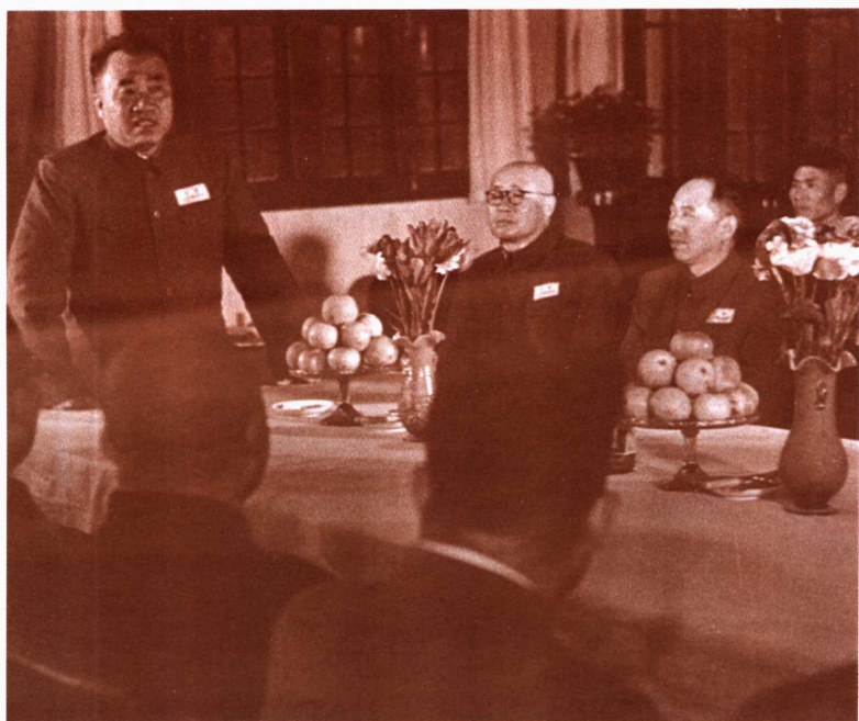
一九五四年四月，朱德赴南京军事学院指导考试委员会工作 左起：朱德、刘伯承、陈伯钧