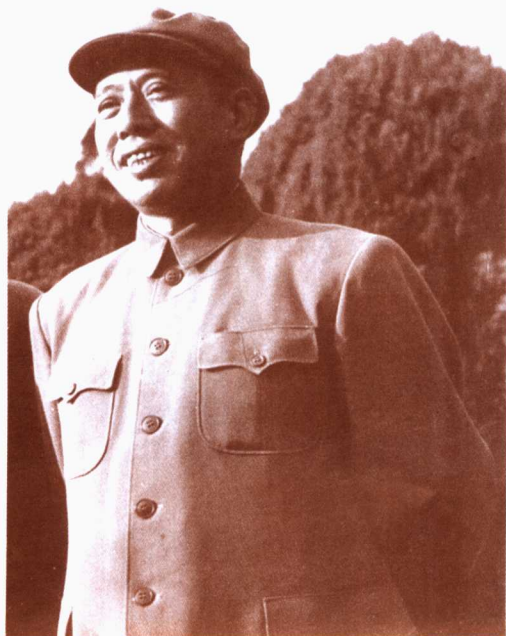
六十年代初期在高等军事学院住宅附近留影