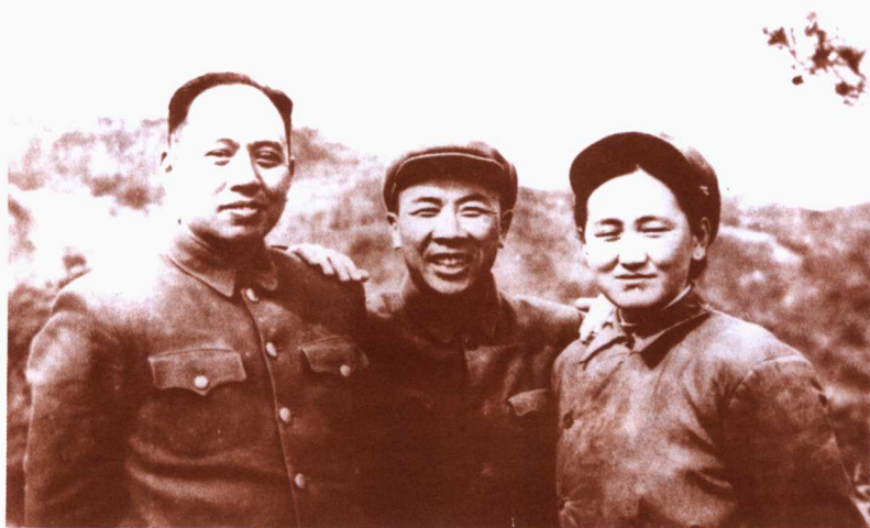
一九五二年春，陈伯钧和曾思玉及其夫人在朝鲜前线合影