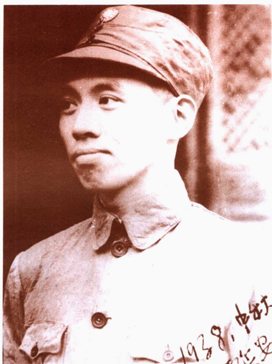
一九三八年秋于延安抗大