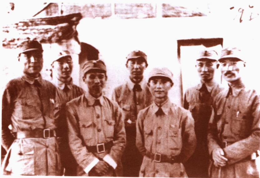
一九三九年在晋察冀高级军事干部会议期间留影 前排左起：聂鹤亭、陈伯钧、舒同、孙毅 后排左起：杨成武、王平、程子华