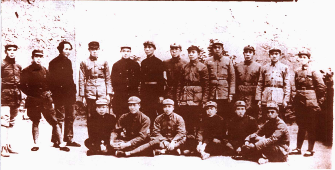
一九二七年秋收暴动成立工农革命军第一军第一师至今尚存之人约数十人，此为一部分。后排左二为陈伯钧，左三为毛泽东 一九三七年五月摄于延安城