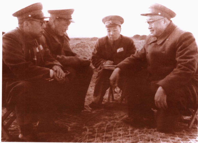
一九五四年十一月十七日至三十日，在山东省平度县张戈庄 组织集团军进攻海岸防御的首长一司令部演习 右起：刘伯承、肖华、张宗逊、陈伯钧