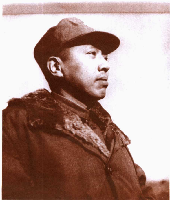
一九四八年春，调任东北野战军前方指挥所任第一副司令员