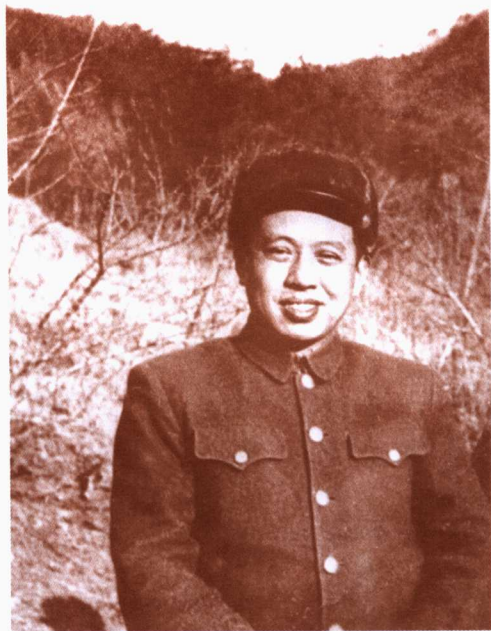
一九五二年春，陈伯钧在朝鲜前线