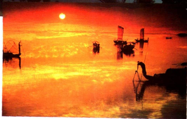
渔歌唱晚