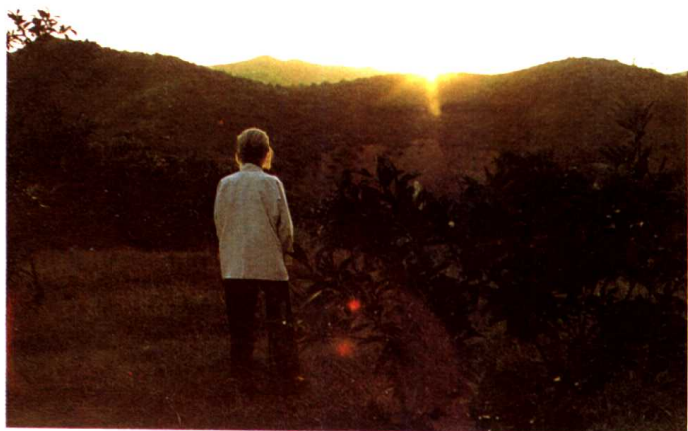
迎祭朝阳