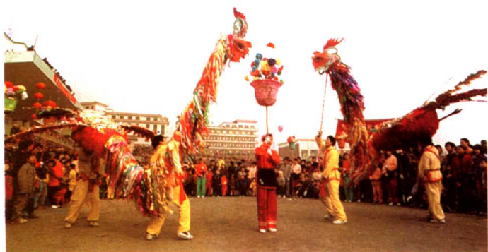
凤凰灯舞