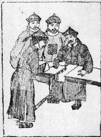
這 個 變 態 不 是