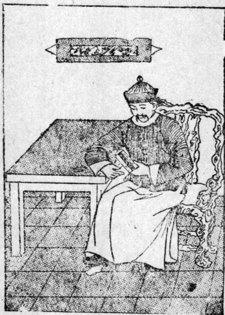
把一些茶葉裝在空信封裏

茶葉裝在空信封裏，外面用麵糊，加鹽封上。裏面，外面一個字也不寫。盧接着信，覺得奇怪得很，想了一刻，就知道了，是隱着「鹽案虧空查抄」六個字。遂趕快，把他餘下來的錢財，寄在別地方。等到來查抄財產的時候，他存的錢財就很少了。和珅是紀曉嵐的仇人，他打聽得這件事有點奇怪，就在乾隆皇帝面前，告訴是紀曉嵐漏了消息。皇帝叫紀曉嵐來，問他怎樣漏了消息。紀曉嵐一定不肯