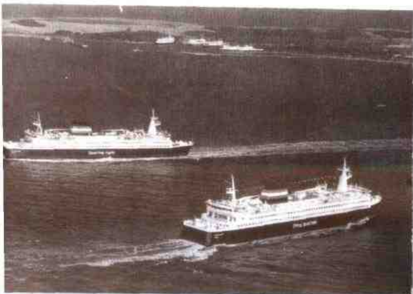
横渡大海峡的大型渡轮