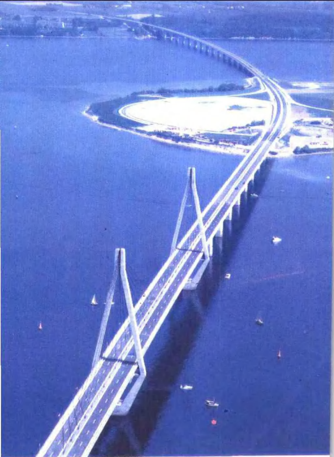
西兰岛和弗斯特岛之间新建成的法罗桥