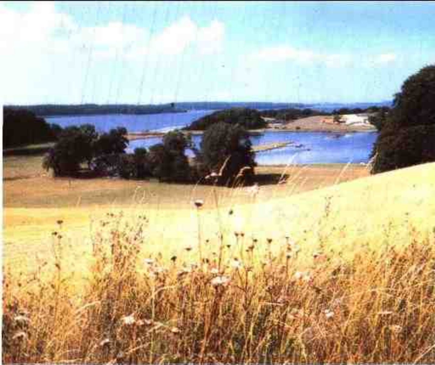
西兰岛的原野和峡湾美景

断。日德兰中部到处是沼地、湖泊和“山脉”。丹麦人有些夸张地形容其中一座山是“天山”，这座“天山”却还不到 170 米高。日德兰岛的东海岸犬牙交错，有许多水湾，周围是树林和肥沃的农田。多数大一些的岛屿生机盎然，肥沃的耕地、城镇和村庄错落有致。岩石重叠的博恩霍尔姆岛是个例外，其地理特征更象瑞典的山脉。