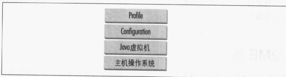
图 1-1: J2ME 运行时环境的高级体系结构

头两种组件组成了J2ME的运行时环境。运行时环境的关系视图如图1-1所示。它的核心是Java虚拟机,运行于设备的主机操作系统之上。再往上是具体的J2ME configuration ,包括根据设备的资源需要提供基本功能的编程库。 configuration 的上面是一个或多个J2ME profile ,这些附加的编程库利用了相似设备的类似功能。