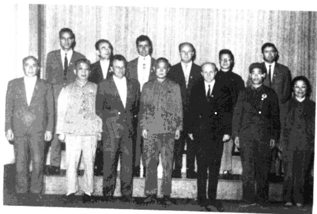
● 赖际发同志（前排左二）陪同李先念同志接见外宾