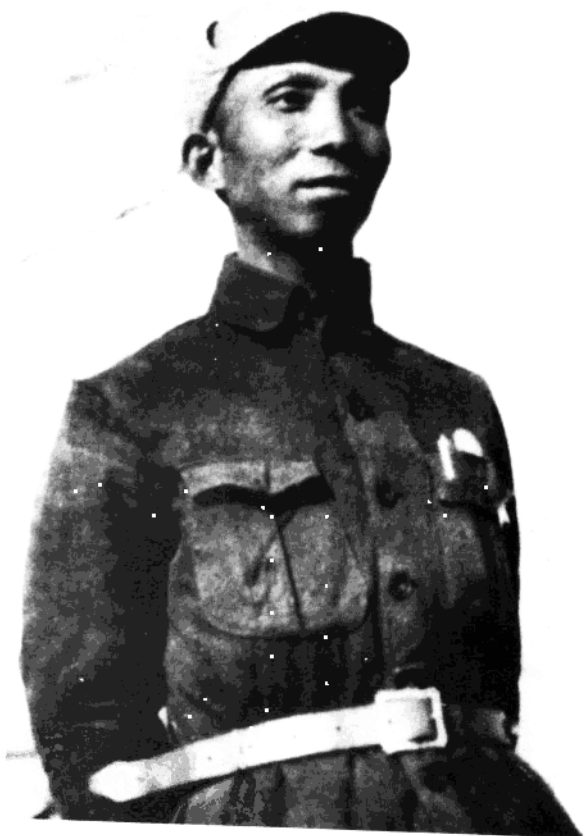
● 抗日战争时期的赖际发同志