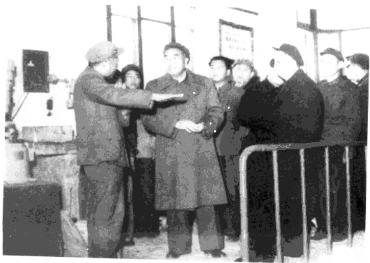
● 王涛同志（左一）向朱德、翰际发同志汇报工作