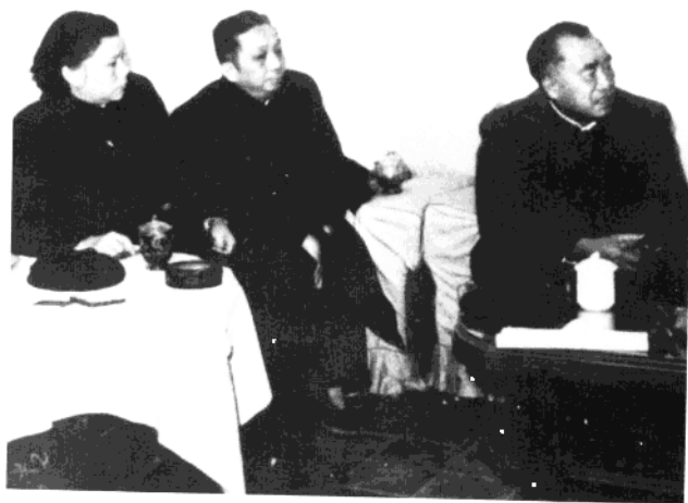
● 赖际发同志陪同朱德、康克清同志听取建材军工产品试生产汇报