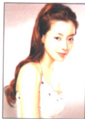
KIM HEE SUN