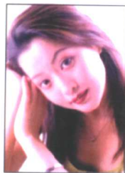
KIM HEE SUN