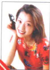
KIM HEE SUN