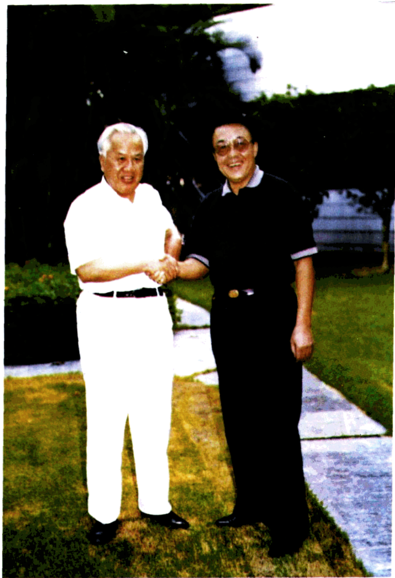
作者与全国政协副主席、原国家计委主任陈锦华合影。