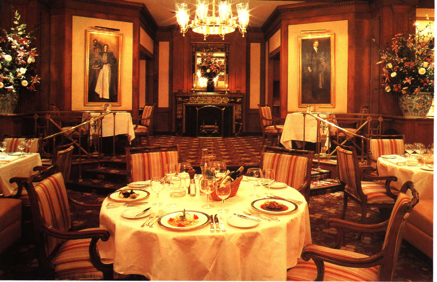
西餐厅的环境需要高贵而庄重的气氛