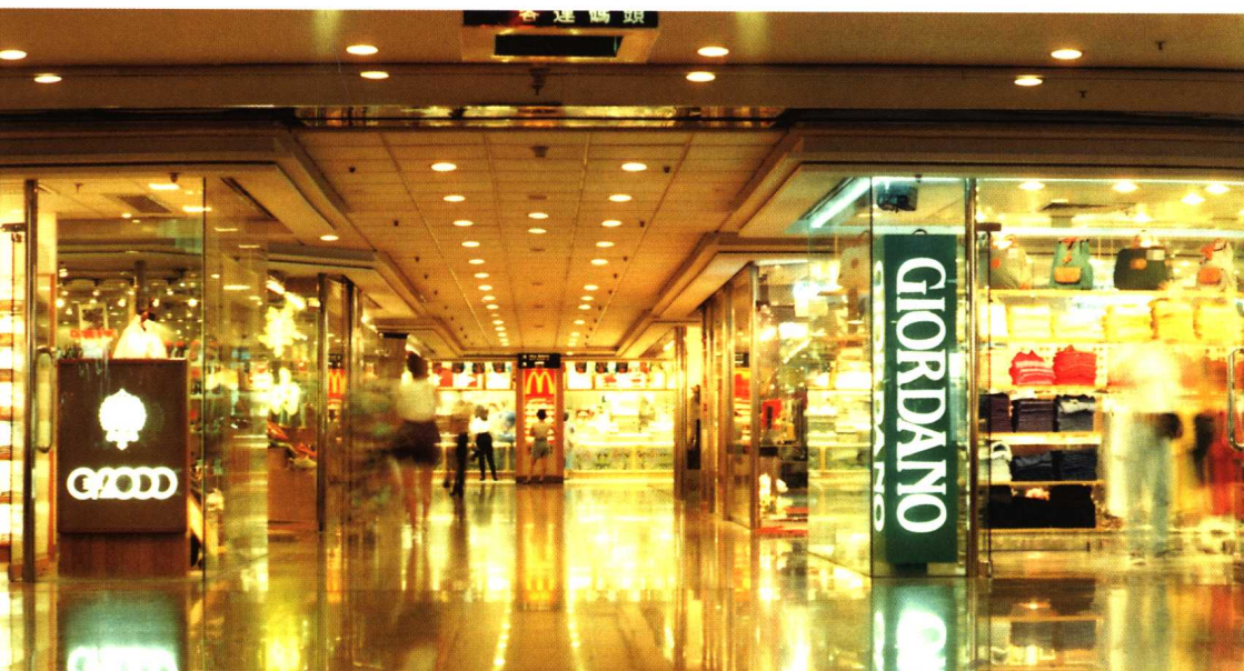
购物中心内部的专业商店，以独有的空间设计语言、商业设施形式吸引顾客