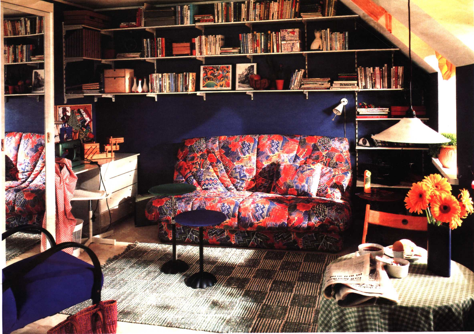
深蓝色墙面可以使房间充满宁静而厚重的感觉。由于突出了陈设用品，渲染出浓郁的生活气氛