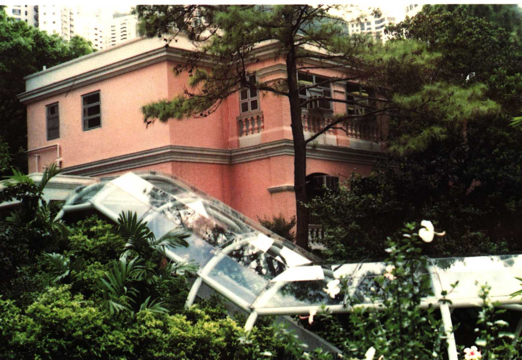
香港结婚登记处的长廊