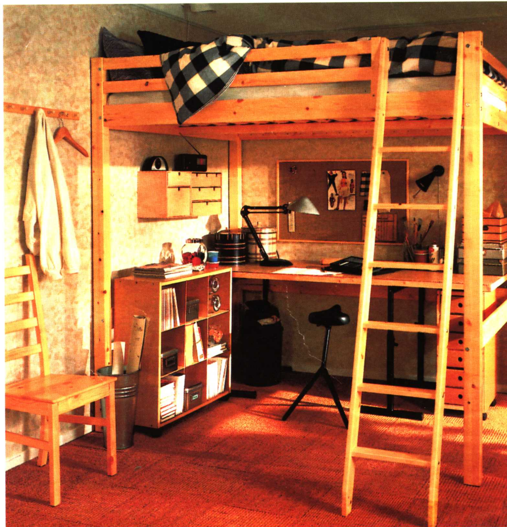
工业化生产的木质家具