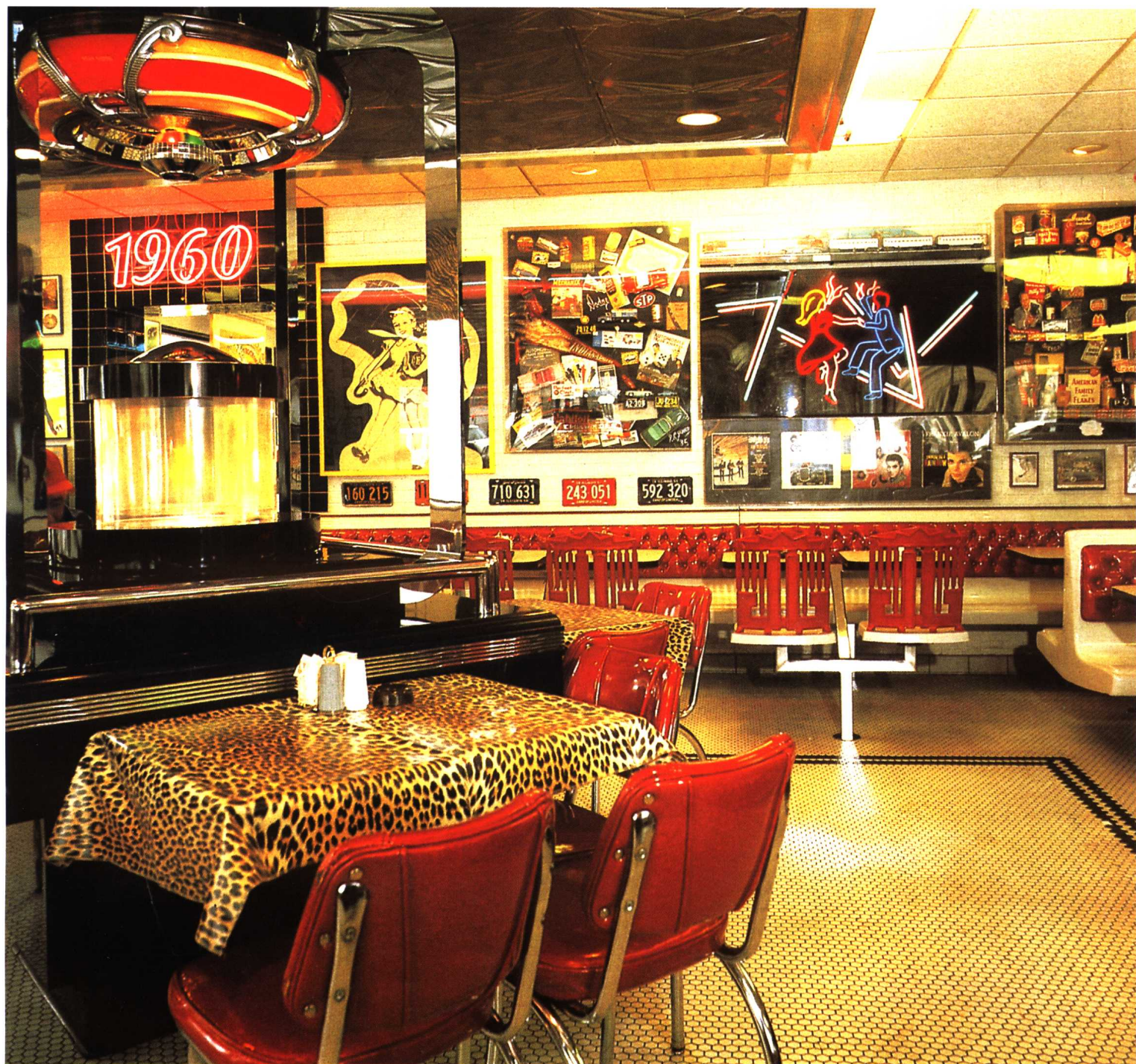
麦当劳快餐厅的环境反映了本世纪60年代美国社会的流行文化。当放在90年代的环境中时，便是两代人的文化沉积空间。快餐的文化和文化的快餐，相互融合成为通俗艺术的主流