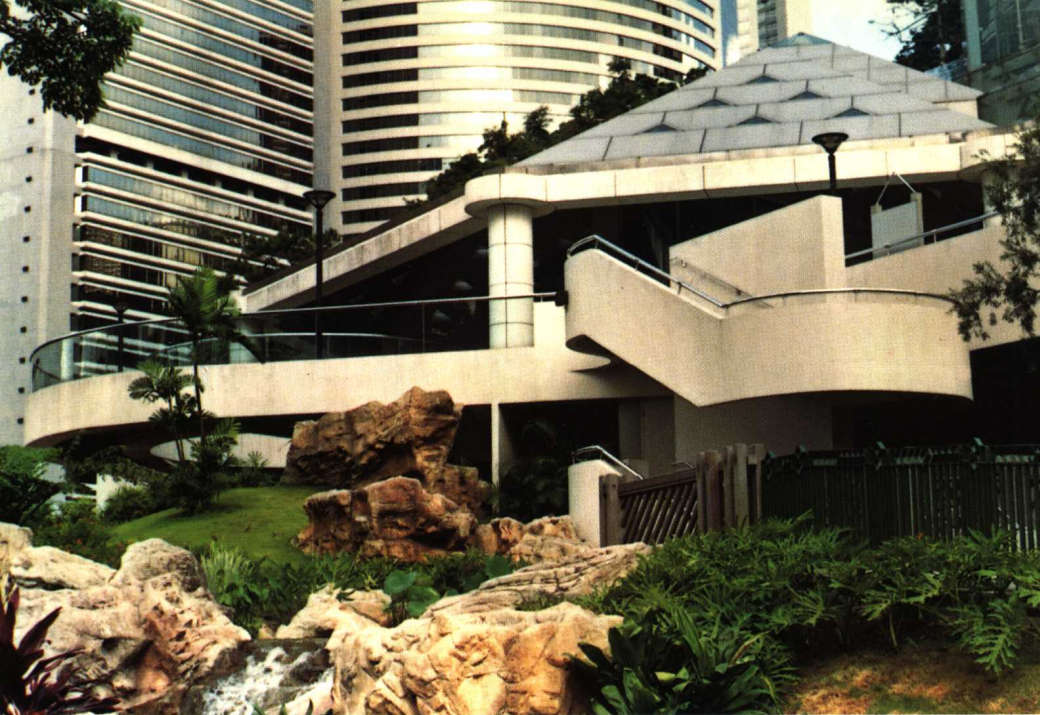
香港热带植物园 人工园林与现代建筑