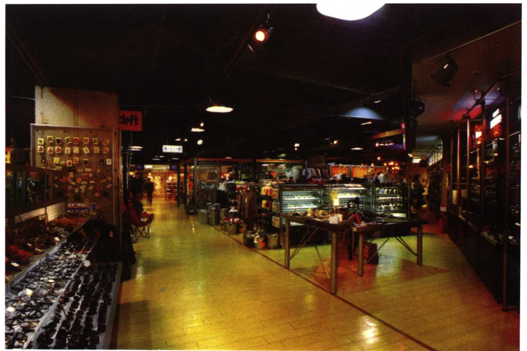
大型平价自选市场以充足的货源、齐全的商品种类和低造价的装修环境来降低商品的价格，以吸引顾客