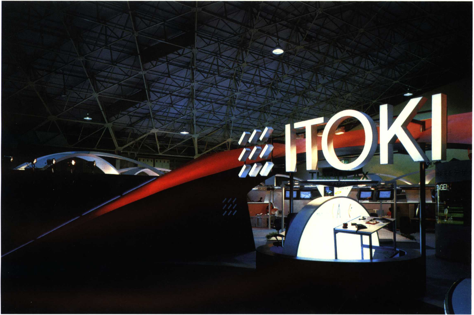
金属材料的配置，暗示新时代的特征，并完全与传统生活分离的空间环境