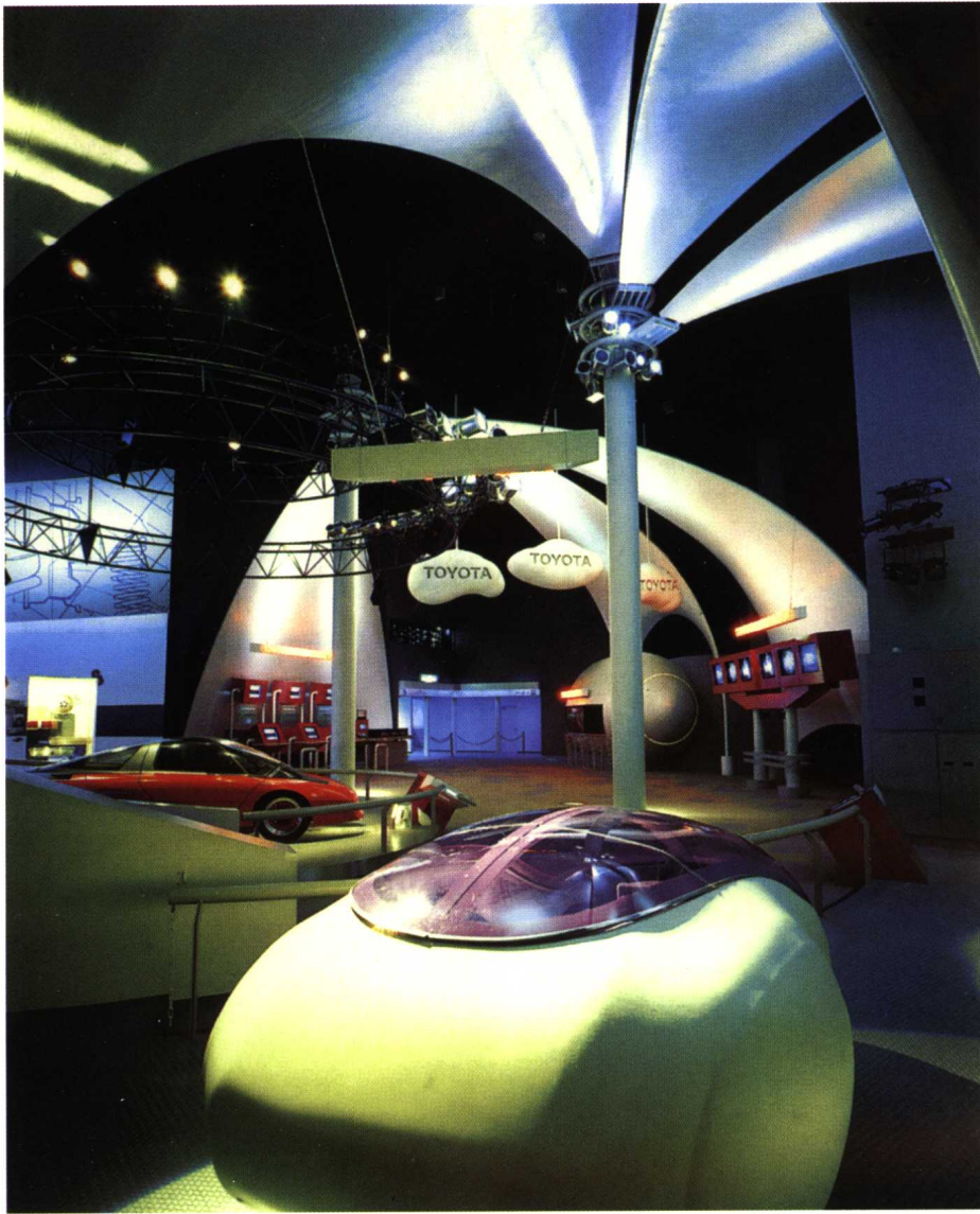
软模空间设计体现未来建筑的审美倾向