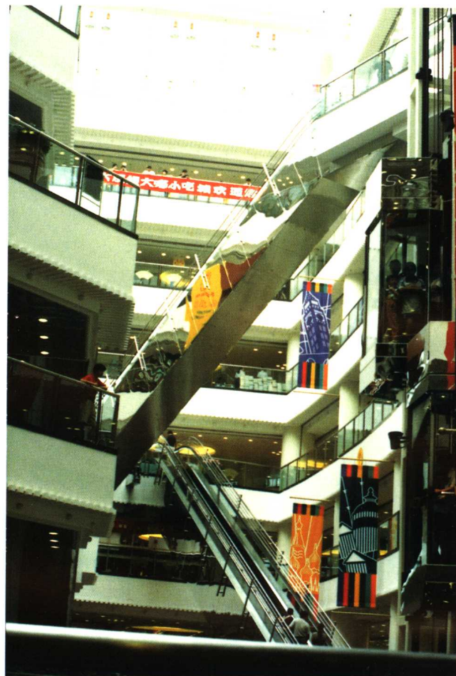
交错的垂直疏导升降梯和自动扶梯