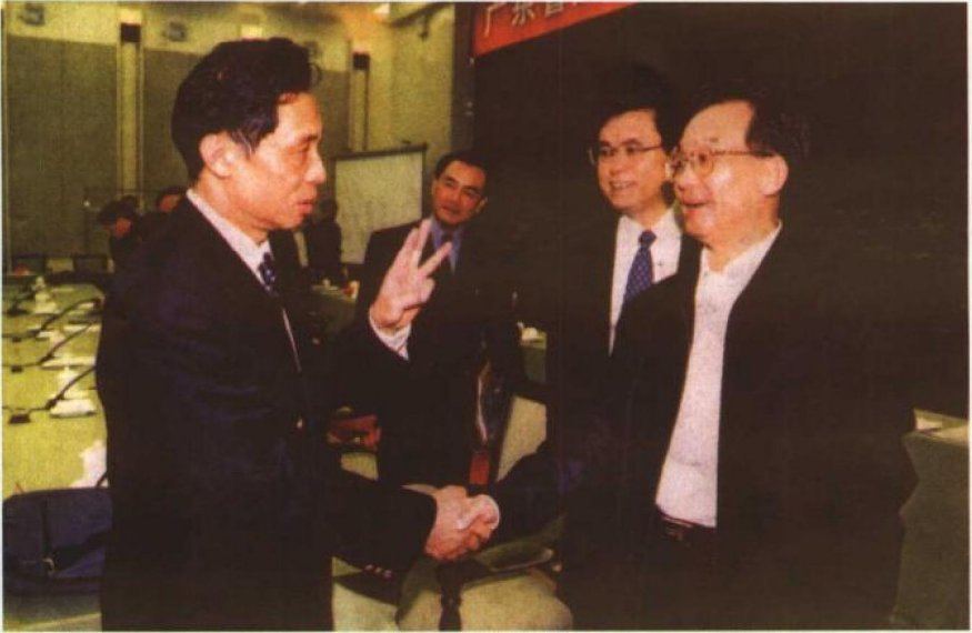
国务院总理温家宝到广州视察疫情时，会见中国工程院院士、广州呼吸疾病研究所所长钟南山。右二为广东省省委书记张德江。