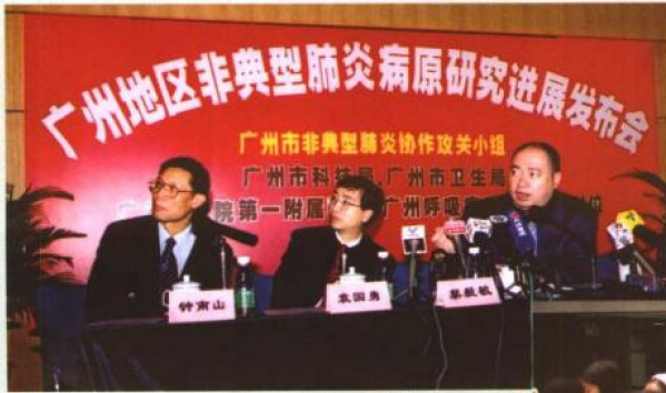
广州地区非典型肺炎病原研究进展发布会