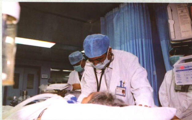
在2003年春的“战疫”中，钟南山始终坚守在抗击非典最前线