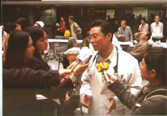
钟南山就广东非典型肺炎答记者问