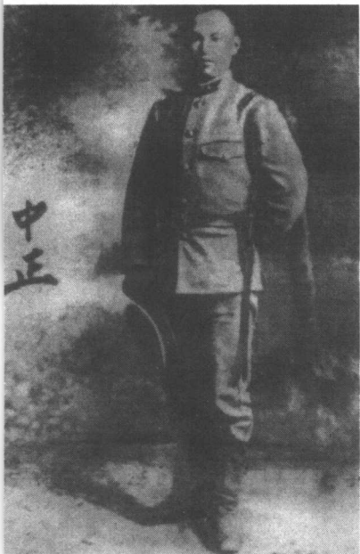
1910年，蒋介石在日本高田野炮兵联队入伍，为士官候补生。