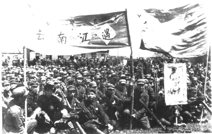
1949年6月，第50军南下参加解放战争，部队召开誓师大会