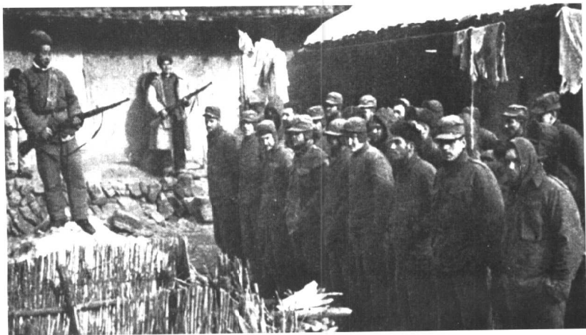
被第50军俘虏的英军官兵