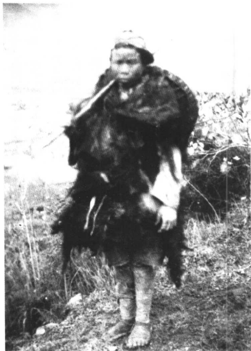
第50军入川作战时，一名国民党军娃娃兵被解放时的情景