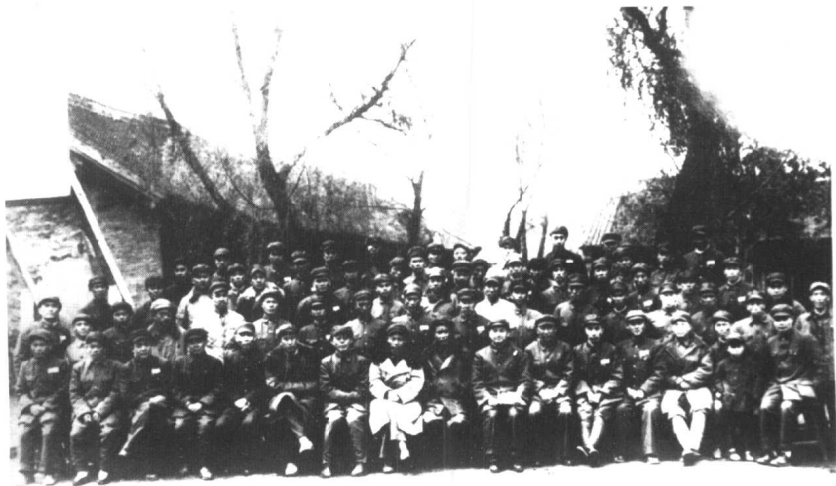
1949年5月13日，第50军部分指战员在九台整训期间合影