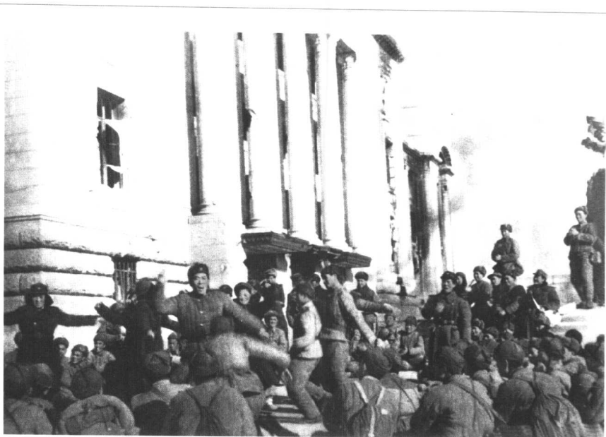
第50军官兵与朝鲜人民军在汉城国会大厦前联欢