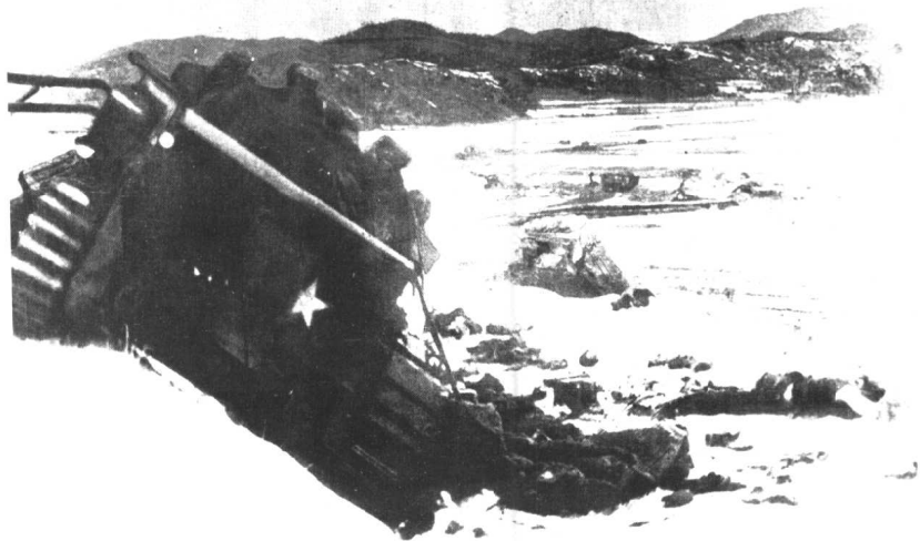
第50军参加抗美援朝战争，第149师歼灭英军皇家重坦克营