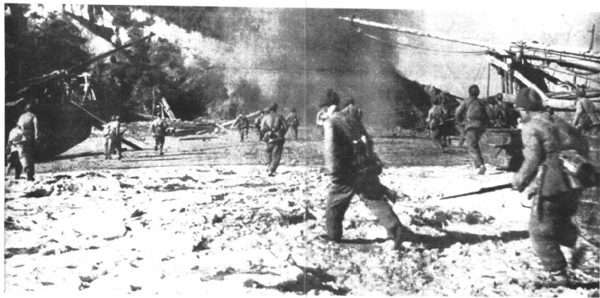
1951年11月30日，第50军第148师第442团在轰炸机的支援下，渡海攻占朝鲜西海岸的大、小和岛