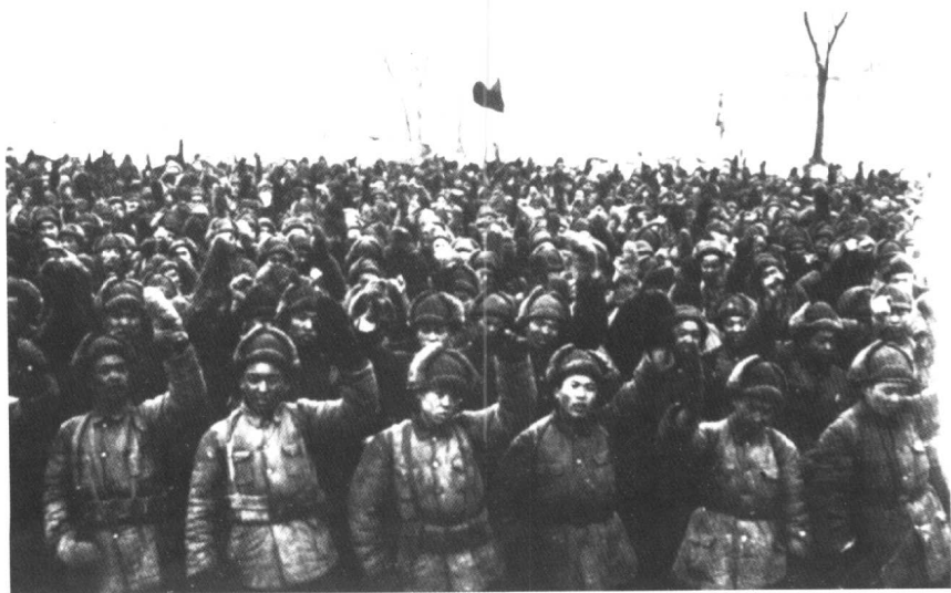
起义官兵在控诉运动中（赵国璋摄）