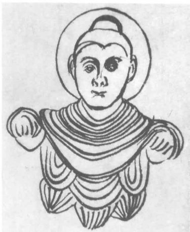
堆塑罐佛像綫描 西晉 江蘇金湖縣出土

像，如四川彭山崖墓出土的陶「搖錢樹」座上塑造的佛像，佛被塑在傳統神仙的位置，而姿態、衣紋處理也和神仙像（如西王母）相同。說明中國初期的佛像塑造，是與傳統的神仙概念相混合的。這件佛像的服飾披通肩大衣，可以看到受犍陀羅藝術的影響，但其衣紋居中而下垂，拱手端坐，則又是中國神仙像的式樣。其塑造技法仍屬漢式，說明中國的佛教雕塑，從一開始就不是全搬外來的形式而植根於傳統的藝術之上。