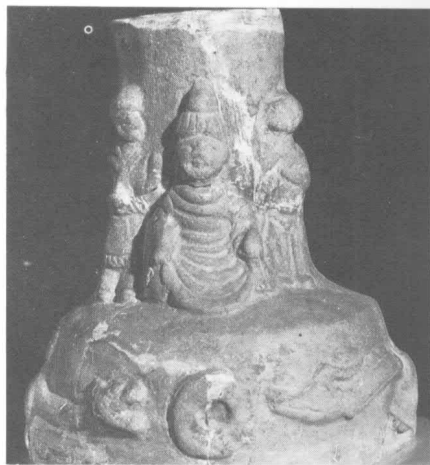
佛像陶插座 東漢 四川彭山縣出土