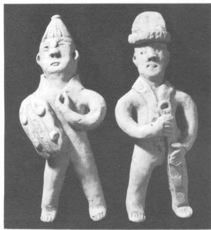
武士俑 西晉永寧二年(公元三〇二年) 湖南長沙金盆嶺出土

由於人們對自然及客觀事物認識的歷史局限，加之戰爭之動亂，宗教大肆泛濫。相應的宗教美術得到了廣泛傳播，這個時期遺留的雕塑作品也以宗教（主要是佛教）雕塑為多，佔據雕塑史的主要地位。