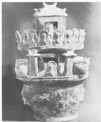
穀倉罐 西晉 江蘇南京高場一號墓出土

坐，拱手置于胸前。以上這些說明吳、西晉時期佛教已在一定程度上流行到長江中下游一帶的社會基層。