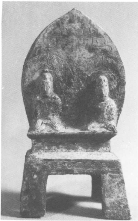
王上造像 北魏太和二年(公元四七八年) 山東博興縣出土