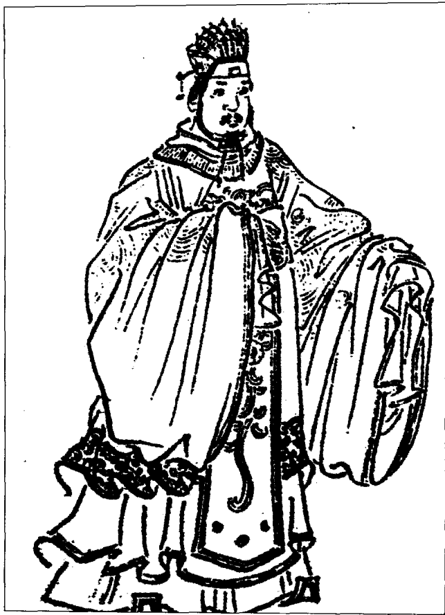
大商人、大政治家吕不韦