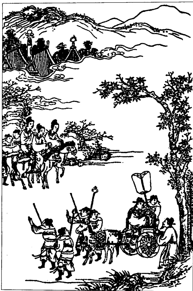
王孙异人入赵为人质

光和美景。异人心里清楚，秦军虽然失利于邯郸城下，然而迟早会再次派大军进攻赵国。到那个时刻，自己只能客死他乡，难以回到秦国。思前想后，异人感到来日归国的希望十分渺茫。