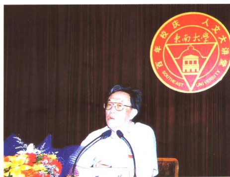
著名作家王蒙在“人文大讲堂”上演讲