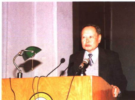
杨振宁教授应邀主讲“华英文教基金——大师讲座”