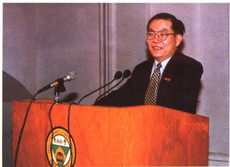
中国科学院外籍院士田长霖教授畅谈高等教育