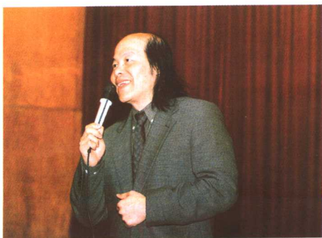
台湾著名作家林清玄在东南大学演讲