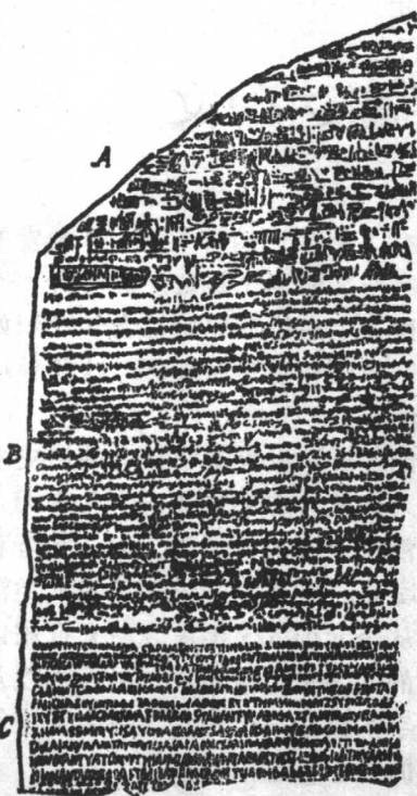
罗塞达石碑的一部分