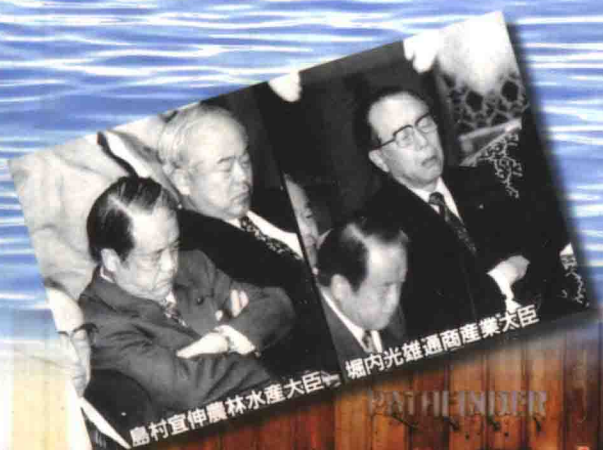
島村宣伸農林水産大臣 堀内光雄通商産業大臣