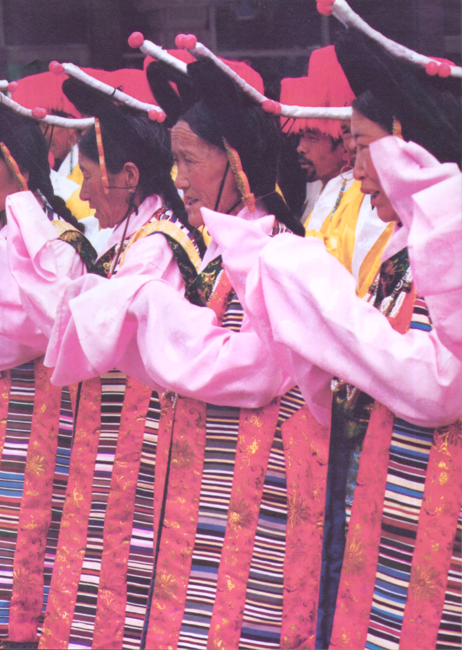
◆后藏妇女节日礼仪装束。