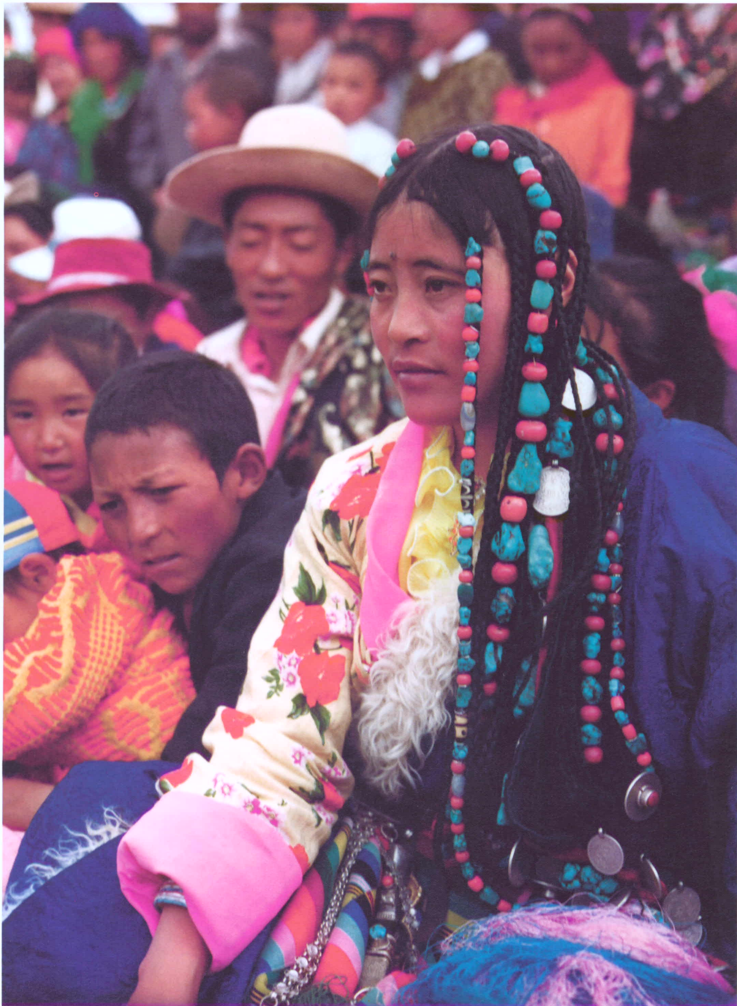
◆佩戴长串豪华发饰的少女。