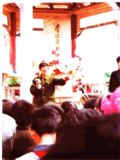
爆炸英雄李混子生前战友在给大岳学区中小学生学习传统教育