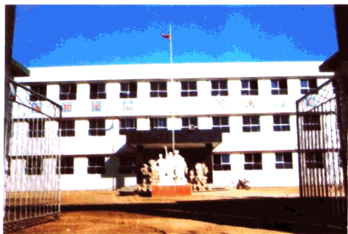
新乐东场家庄小学