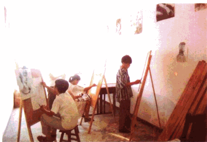
新乐第二中学课外 美术活动