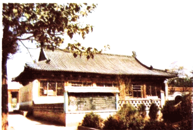
新乐县文庙大成殿