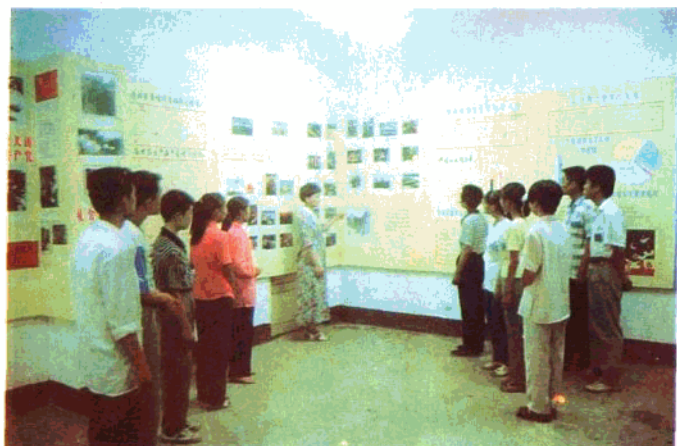
新乐第二中学利用德育展览室对学生进行德育教育