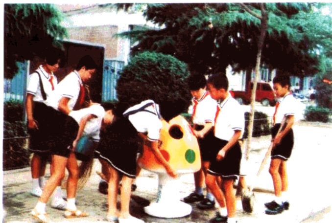
新乐干部职工子弟 学校少先队员们上街清 扫环境卫生