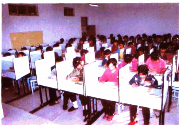
新乐第一中学学生在上语音课