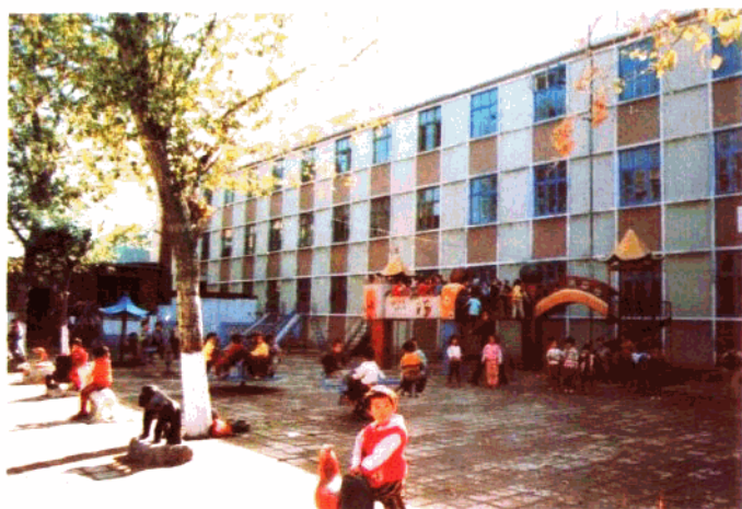
新乐县直幼儿园的 室外活动