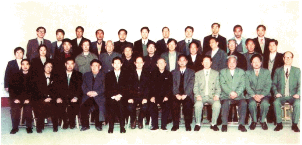
参加新乐教育志第二次评审会的专家、教授、市、县领导及兄弟县（市、区）教育（文教）局领导、主编与新乐教育志编写人员合影