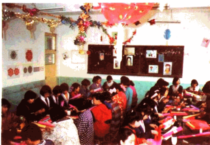
新乐东长寿小学学 生课外手工活动