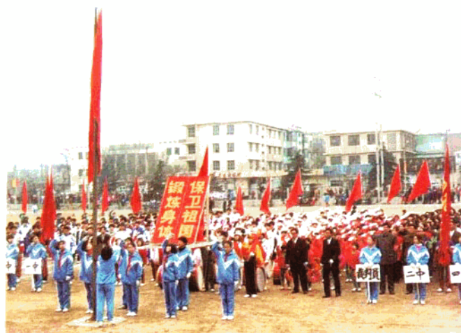
1990年新乐县中小学生田径运动会开幕式