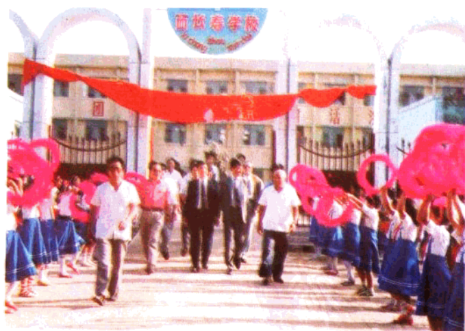
1992年9月6日，联合国教科文组织基础教育司司长澳得内斯先生、亚州开发银行教育专家前田明女士、联合国开发计划署驻北京代表处助理代表瑞俊丹先生等到新乐考察全民教育情况