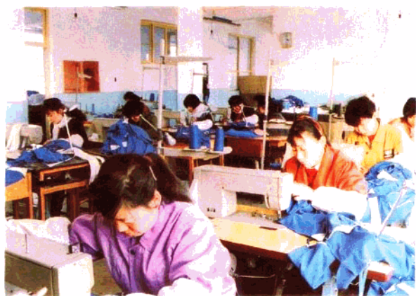
新乐职教中心服装专业的学生在实际操作