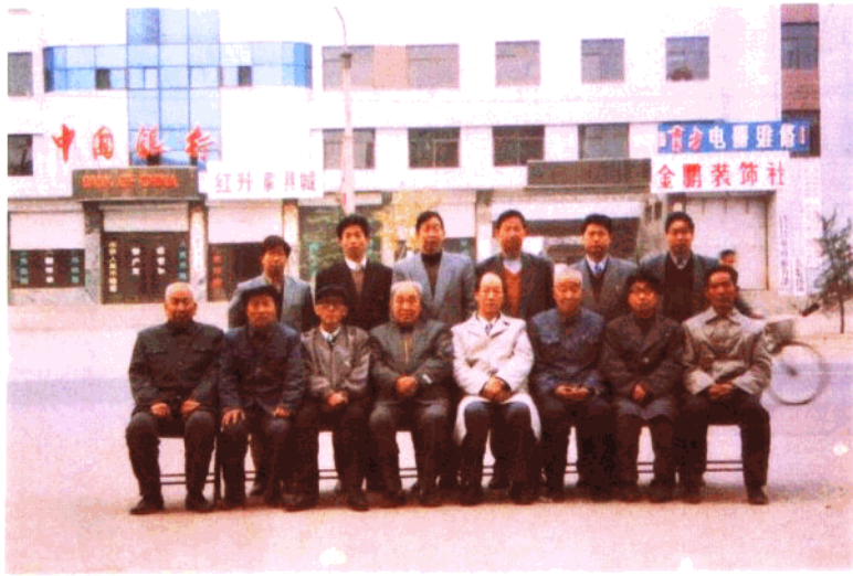
参加新乐教育志第一次评审会人员合影