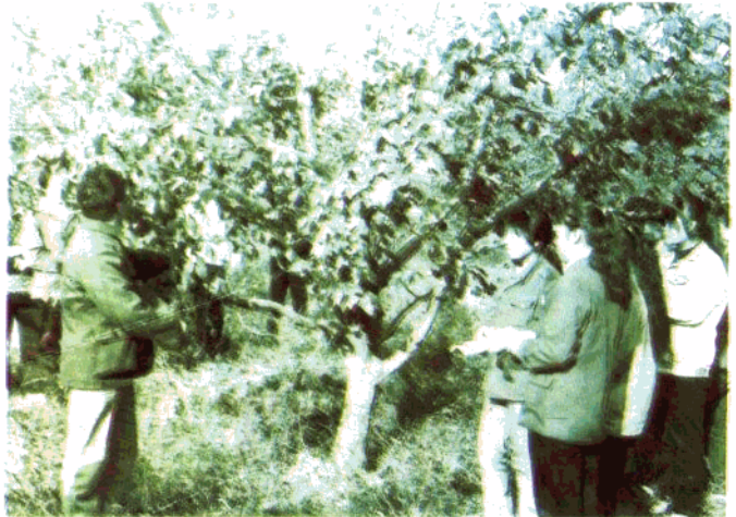
新乐第四中学学生正在上果树管理课