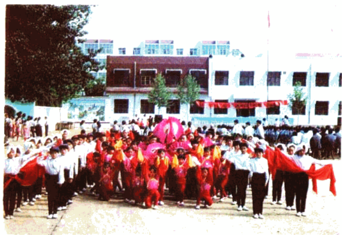
新乐化肥厂小学文艺队在排练