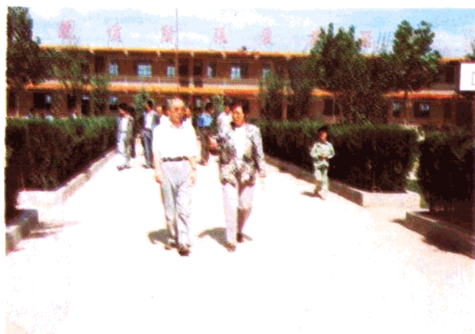
1990年9月23日，省教委副主任安效珍视察芦新村学校