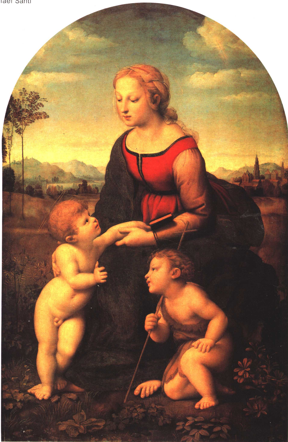
《聖母子與幼兒聖約翰》