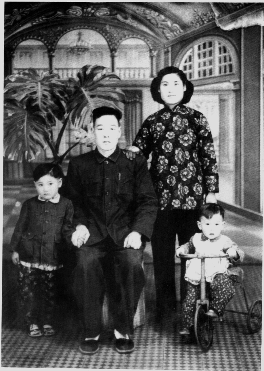
② 新中国成立后的中山装(中西合璧的华服)