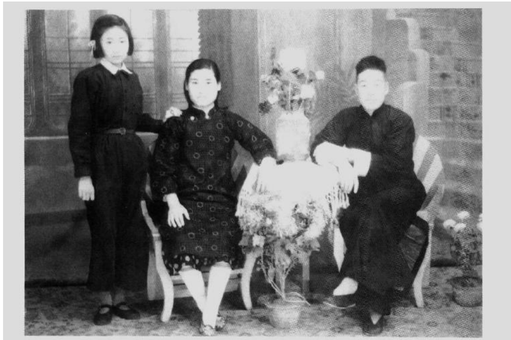
① 新中国成立前的改良旗袍和马褂(以本上华服为主)

从清末的满汉华服到民初的中西合璧；从 1930 年代的中山装到新中国成立后的人民制服及文革时期的军服 ★ ，走了近一个世纪的漫漫长途，演绎了一串串服装变革的故事，而且每一次变革都伴随着一次革命（图 1-3）。在轰轰烈烈的中国以外的洋装世界却表现出相当的稳定。改革开放以来，洋装再次涌入中国，而礼服的规范和民国初年没有什么两样。这足以说明男装礼服语言的严谨和稳固，和它保持功能内涵的社会伦理、集体表象的特征有着深刻的关系，这被视为礼服西方惯例国际化的关键所在。