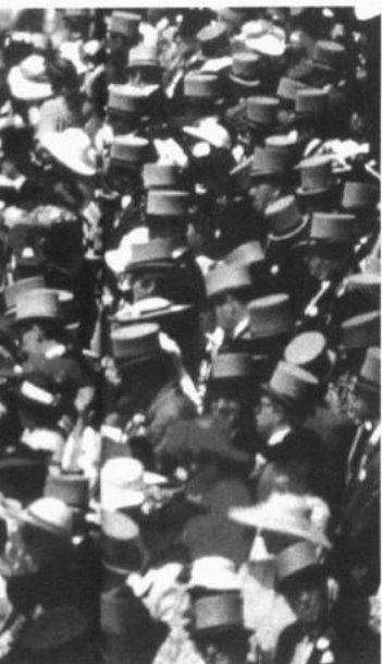
图中左上角「被确认的服装规则」且专指男装 THE DRESS CODE 直译为

行所左右，一旦男装发生了莫名其妙的改变，就会变得盲目而失去自信。男装稳定的形制列载于男装历史的法典上成为男人们的愿望*。在男人社会看来，对服装语言的认识标志着修养、尊严和地位，失去或根本就不具有这种语言，就难以进入白领社会。我们从《泰坦尼克号》电影男主角的那套燕尾服就不难理解，它是进入上流社会的入场券。伊拉克总统萨达姆也不能无视服装的力量（实为国际惯例的作用），为亲近和缓与西方大国的紧张关系，