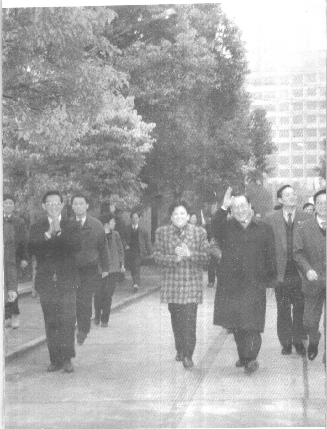
△(照片)李岚清副总理视察上海工大