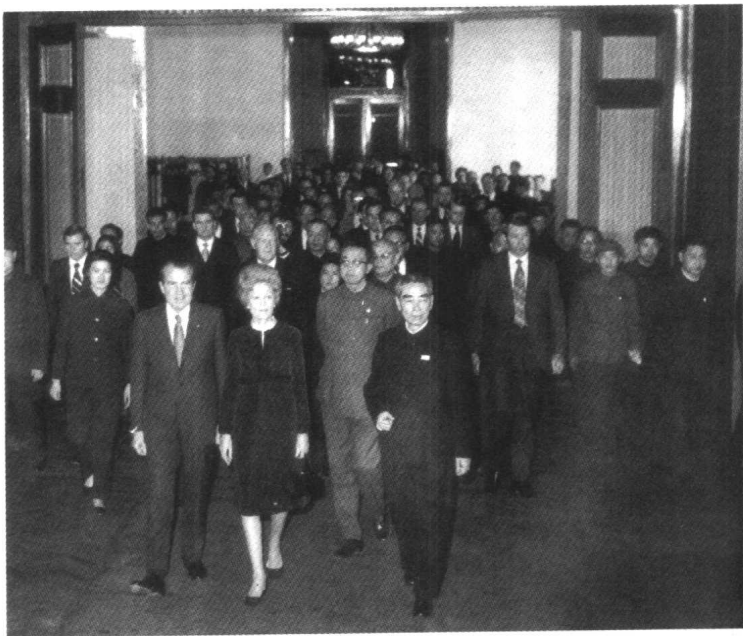
1972年2月21日，周恩来总理在人民大会堂举行盛大宴会，欢迎尼克松总统及其夫人一行。

1972年2月22日，周恩来总理同尼克松总统在北京人民大会堂举行会谈，就中美关系正常化及双方关心的其他问题进行了讨论。周恩来表示：台湾问题是阻碍两国关系正常化的关键。尼克松表示：美国承认世界上只有一个中国，台湾是中国的一部分。