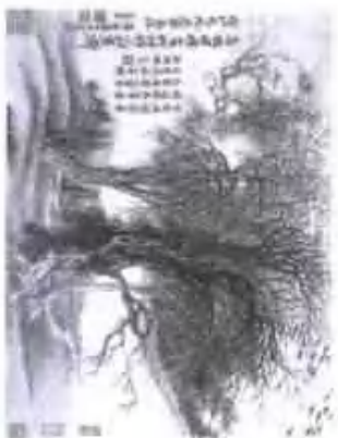
古樹村頭圖 冊頁 紙本設色

Appreciation of Famous Chinese Paintings, Yun Shouping