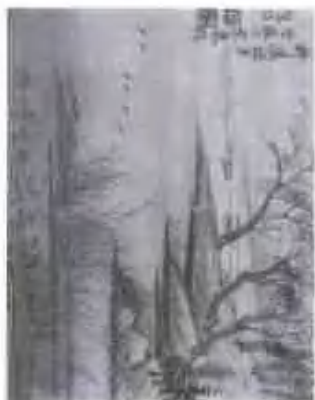
柳溪烟月图 册页 纸本水墨

Appreciation of Famous Chinese Paintings: Yuan Shoupeng