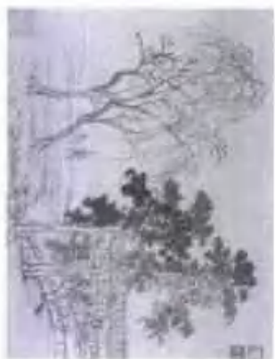
烟雨幽景图 册页 纸本水墨

Appreciation of Famous Chinese Paintings, Yan Shouqing