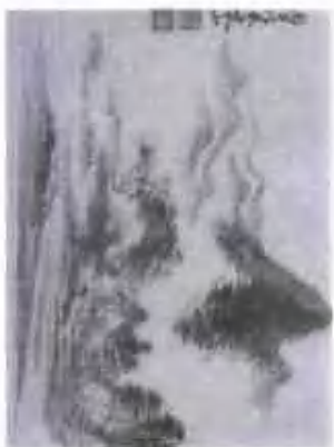
世界名山图 元代 纸本水墨