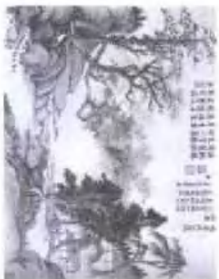
紅霞秋蓉圖 册頁 紙本設色

Appreciation of Famous Chinese Paintings: Yun Shouping