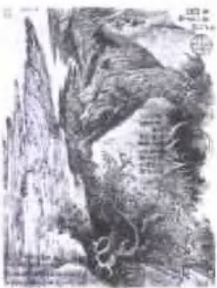
圖山行旅圖 冊頁 紙本設色

Appreciation of Famous Chinese Paintings: Yan Shouping