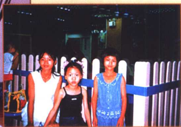
▲ 安子资助的两位特困生（中为安子女儿）