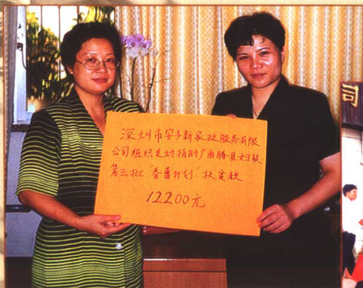
▲ 组织“春蕾计划”扶贫