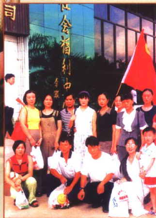
▶ 安子义工队在行动