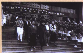
▲ 从平凡的世界归来， 是为了接受青春庄严的 检阅