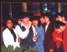
◀ 1997年安子 与打工姐妹共庆 “三八”妇女节