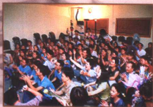
◀ 积极的回应“太精彩了”