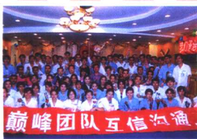
爽力工业园企业内训