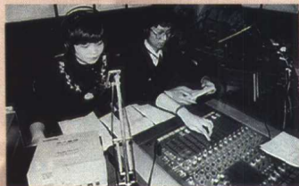
▲ 把远在他乡的日子 编织进安子的天空……