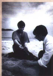
▲ 共同垒起记忆中的 沙器，让波浪般的 日子在身后合拢