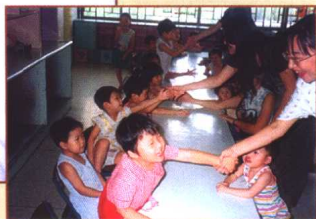
“我不认识你，但我谢谢你”