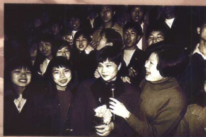
▶ 鲜花和掌声是暂时的，对生活执着的 追求是永久的