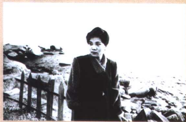
▲ 踏浪看海，只为心中有一个名字 叫远方