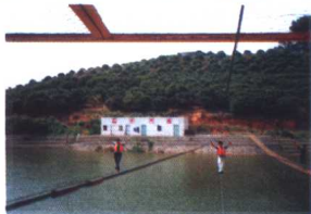
户外展能巅峰体验