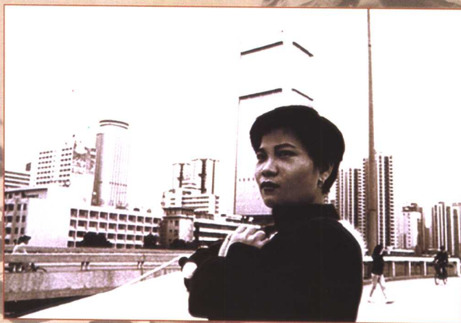
▲ 人在深圳，高楼临风，你会找到 飞翔的感觉