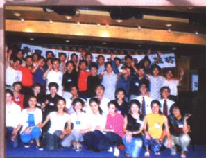
◀ 广田集团企业内训