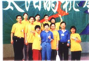
共创美好明天义工活动