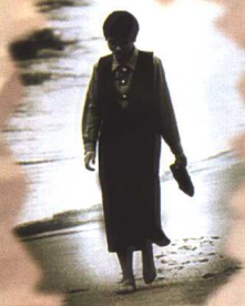
▲ 在语言的沙滩上 行走着，带来了潮 水的声音