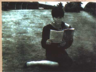
◀ 站在知识的制高点，也 就是最靠近太阳的地方