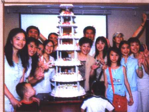
► 心灵的圆舞，有效果比有道理重要